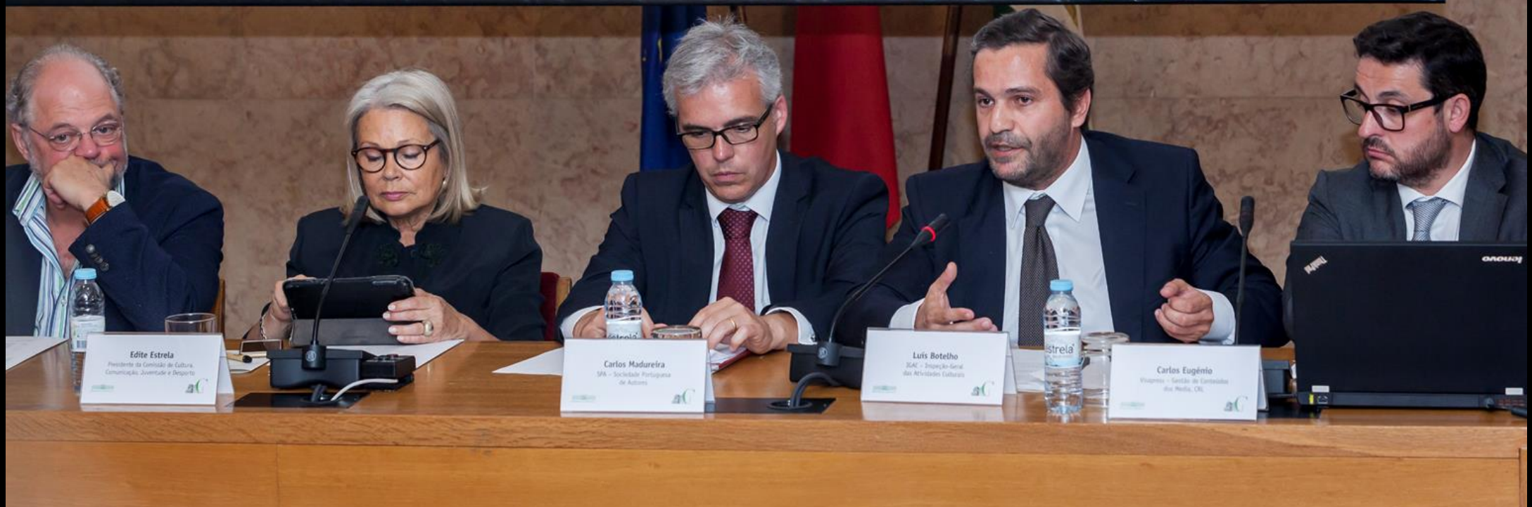
Édite Estrela Presidente da Comissão de Cultura, Comunicação, Juventude e Desporto aC