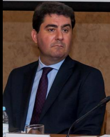
Edite Estrela Presidente da Sociedade de Direitos Autorais, Sociedade e Direitos