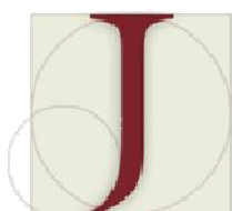
Observatório Permanente da Justiça Portuguesa