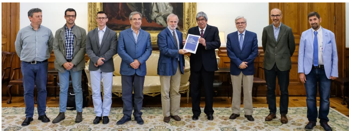
Figura 1. Apresentação do 1.º Relatório de atividades ao Presidente da Assembleia da República, a 3 de julho de 2019.

Deste modo, a primeira atividade do Observatório no início do segundo semestre do seu mandato foi a finalização do relatório de atividades previsto na Lei n.º 56/2018. Esse relatório de atividades referia-se ao período compreendido entre o início de atividade, a 24 de setembro de 2018, e o dia 30 de junho de 2019, tendo sido entregue ao Presidente da Assembleia da República no dia 3 de julho de 2019 (Figura 1).