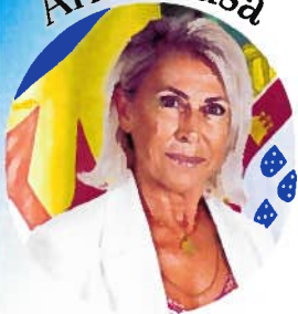
Secretária Regional de Inclusão, Trabalho e Juventude

“A criação da Autoridade Regional para as Condições de Trabalho reforçará a intervenção inspetiva na promoção da melhoria das condições de trabalho, no cumprimento das normas laborais e no aumento do nível de segurança, saúde e bem-estar no trabalho.”