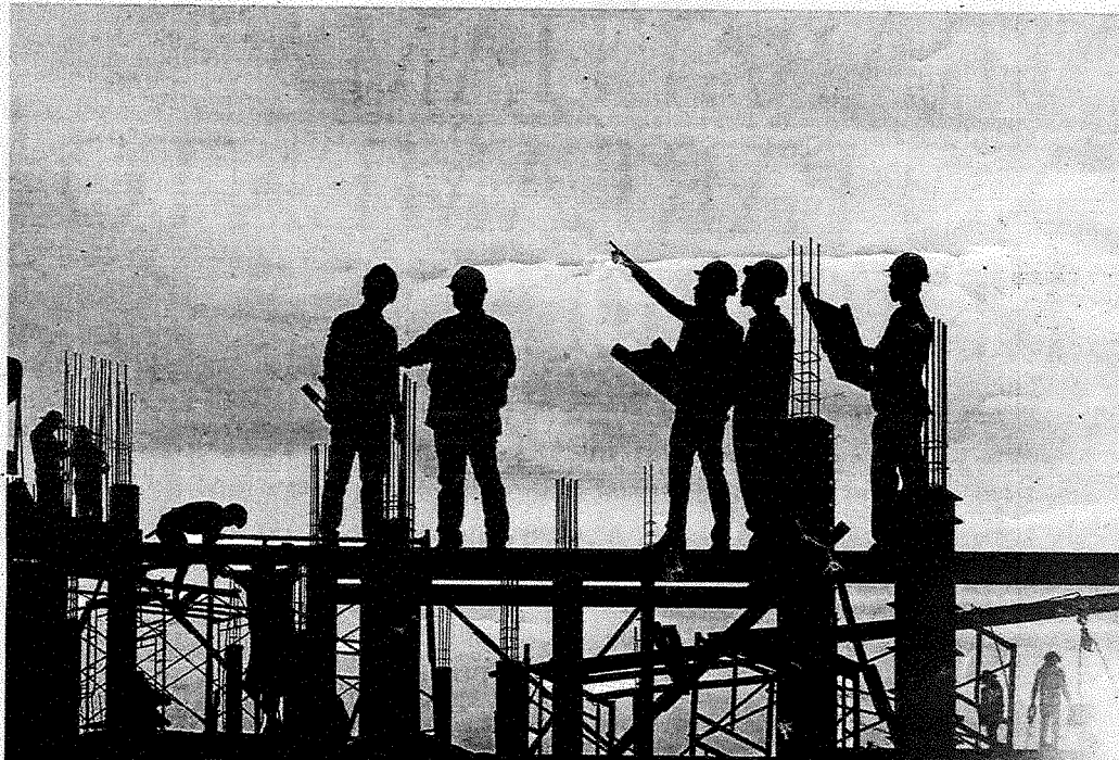
Acções de iniciativa da Inspeção aumentaram 100% na Construção Civil.

trução civil; abrangeu 873 locais de trabalho e a situação de 3.715 trabalhadores e visou assegurar o cumprimento da Lei e do estipulado nos Instrumentos de Regulamentação Colectiva de Trabalho.