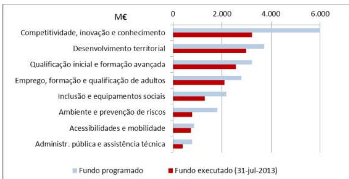
Figura 2. Execução do QREN (a 31 de julho de 2013) por domínio de investimento

No final de julho de 2013 o QREN verificava uma taxa de execução de 65,5%, correspondendo a 14 mil milhões de euros de fundos comunitários, 3,5 mil milhões de euros de financiamento público nacional e 3 mil milhões de euros de financiamento privado. As taxas de execução (fundo programado/fundo executado) variavam nos diferentes domínios de investimento, refletindo aspetos tão diversos como a disponibilidade financeira dos promotores (públicos e privados), o volume e a natureza mais ou menos pontual dos investimentos, ou as dinâmicas de implementação e de gestão dos programas. De uma forma geral, os programas financiados pelo Fundo Social Europeu (onde se destacam os investimentos na qualificação inicial, na qualificação de adultos e na formação avançada) registavam níveis de execução superiores à média, o que reflete, em larga medida, o facto de se tratar de programas financiadores de sistemas públicos, com maior previsibilidade em termos institucionais de procura e de financiamento.