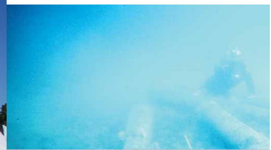
Petição nº 148/XIV/2ª - Contra o aumento da capacidade do porto de cruzeiros de Portimão