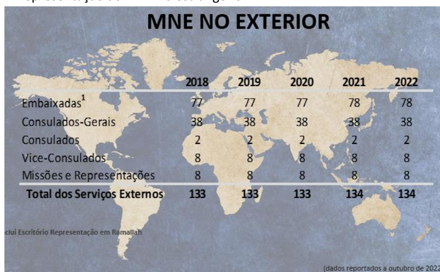
Quadro 6 – Representação do MNE no estrangeiro

A distribuição geográfica dos serviços da rede externa de acordo com o quadro 7 e gráfico 2 mostra que a Europa concentra 40% dos mesmos, sendo ainda de relevar que 7 das 8 Missões e Representações Permanentes se encontram igualmente neste continente.