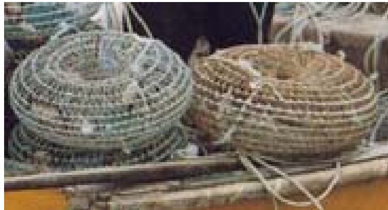
Armadilha de gaiola usada pelos pescadores de Esposende