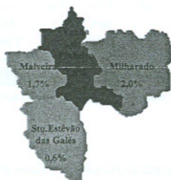
Freguesias do concelho de Mafra

População da área de influência do Hospital de Loures: 261.734 hab.