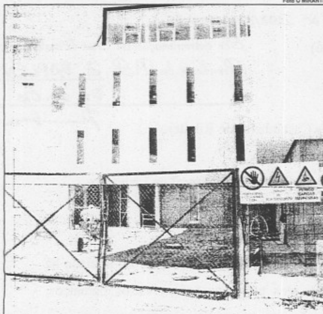
SUPENSÃO. Obras pararam por falta de pagamento

problemas de tesouraria". Com 60 dias de construção ainda pela frente, a construtora "não tinha capacidade para continuar a obra" e, por isso, decidiu tomar medidas.