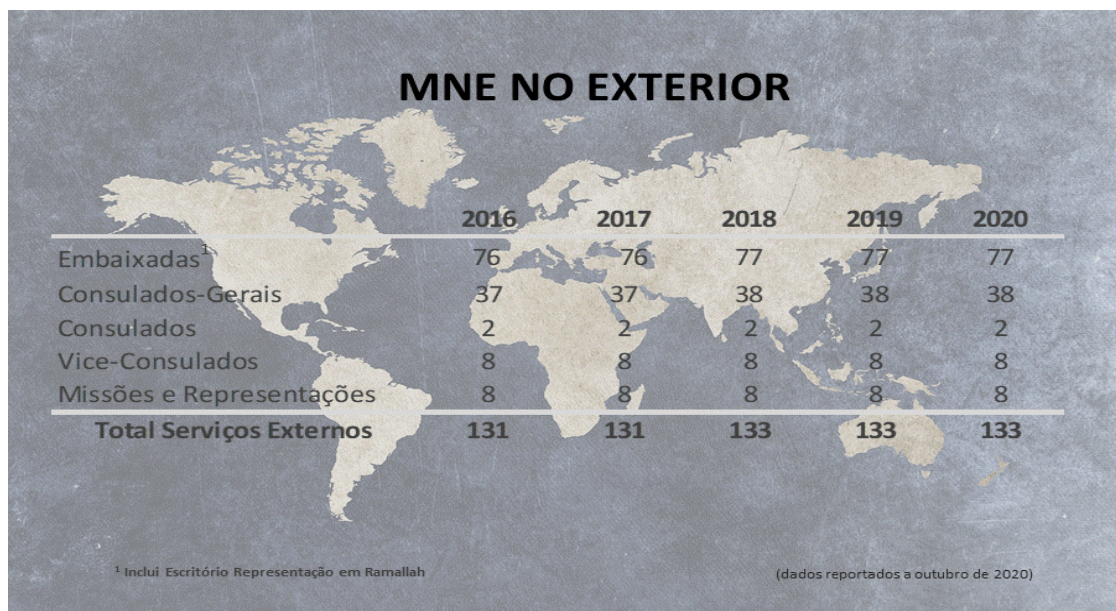
QUADRO 6 - REPRESENTAÇÃO DO MNE NO EXTERIOR DE ACORDO COM EMBAIXADAS REDE CONSULAR E MISSÕES E REPRESENTAÇÕES PERMANENTES

A distribuição geográfica dos serviços da rede externa de acordo com o quadro 7 e gráfico 2 mostra que, em termos geográficos, a Europa concentra 40% dos mesmos, sendo ainda de relevar que 7 da 8 Missões e Representações Permanentes se encontram igualmente neste continente.