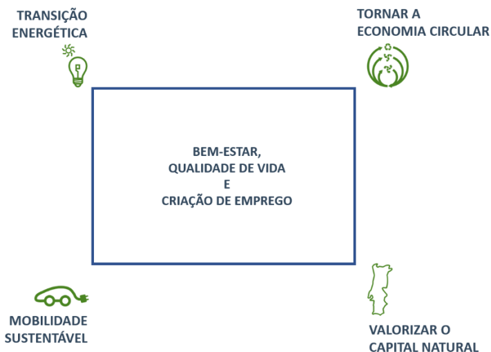
FIGURA 1 – PILARES DE AÇÃO POLÍTICA DO PROGRAMA AMBIENTE

É esta opção estratégica que importa agora prosseguir, reforçar e executar, nesta legislatura, com a inclusão de medidas centradas na ação climática e numa nova visão sobre criação de riqueza e sustentabilidade.