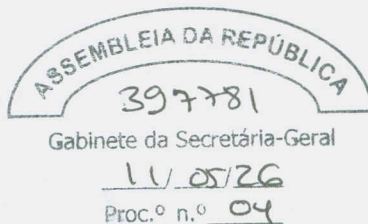
- Anabela Bastos -