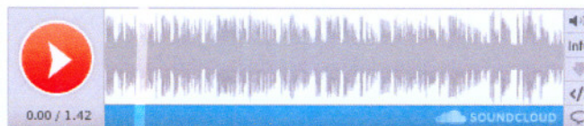
Governador Civil de Portalegre - palestra sobre "Ética Profissional"