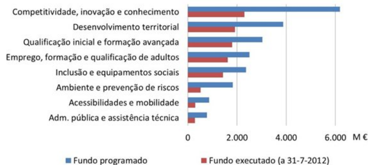
Gráfico 5.2 - Execução do QREN (a 31 de Julho de 2012) por domínio de investimento

No final de julho de 2012, o QREN verificava uma taxa de execução de 48%, correspondendo a 10,2 mil milhões de euros de fundos comunitários, 3 mil milhões de euros de financiamento público nacional e 2,2 mil milhões de euros de financiamento privado. As taxas de execução (fundo programado/fundo executado) variavam nos diferentes domínios de investimento, refletindo aspetos tão diversos como a disponibilidade financeira dos promotores (públicos e privados), o volume e a natureza mais ou menos pontual dos investimentos, ou as dinâmicas de execução e de gestão dos programas. De uma forma geral, os programas financiados pelo Fundo Social Europeu (onde se destacam os investimentos na qualificação inicial, na qualificação de adultos e na formação avançada) registavam níveis de execução superiores à média, o que reflete, em larga medida, o facto de se tratarem de programas financiadores de sistemas públicos, com maior previsibilidade em termos institucionais de procura e de financiamento.