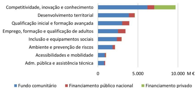
Gráfico 5.1 - Investimentos programados no QREN por domínio de investimento

O QREN assume cinco grandes prioridades estratégicas nacionais: (i) a qualificação dos cidadãos; (ii) a dinamização do crescimento sustentado; (iii) a promoção da coesão social; (iv) a qualificação dos territórios e das cidades; (v) e o aumento da eficiência e qualidade dos serviços públicos. Face a anteriores períodos de programação dos fundos estruturais, o QREN reforçou a prioridade atribuída ao investimento (em particular, ao investimento privado) em competitividade, inovação e conhecimento e na melhoria do capital humano (qualificação de jovens e adultos e formação avançada).