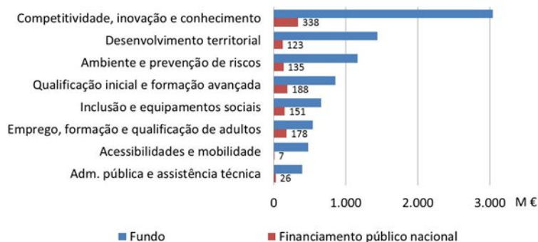
Figura 5.3 - Previsão da execução do QREN após 2012 por domínio de investimento

Não sendo possível estimar com rigor o perfil temporal de execução do QREN após 2012, prevê-se que os valores referidos sejam distribuídos equitativamente entre 2013 e 2014, tendo em conta os valores previstos na programação anual dos Programas Operacionais do QREN, na sequência das propostas de reprogramação do corrente ano apresentadas à Comissão Europeia.