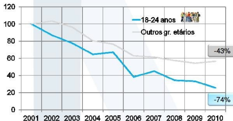
Evolução das Vítimas Mortais

ANSR AUTORIDADE NACIONAL SEGURANÇA RODVIÁRIA