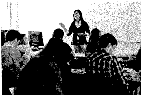
Stress pode afetar a qualidade do ensino

Os professores portugueses têm um nível de stress superior à população norte-americana, considerada uma das sociedades mais stressantes, conclui um estudo sobre o esgotamento físico e mental.