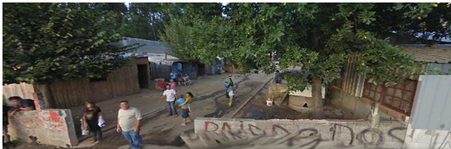
Sanguedo, Santa Maria da Feira