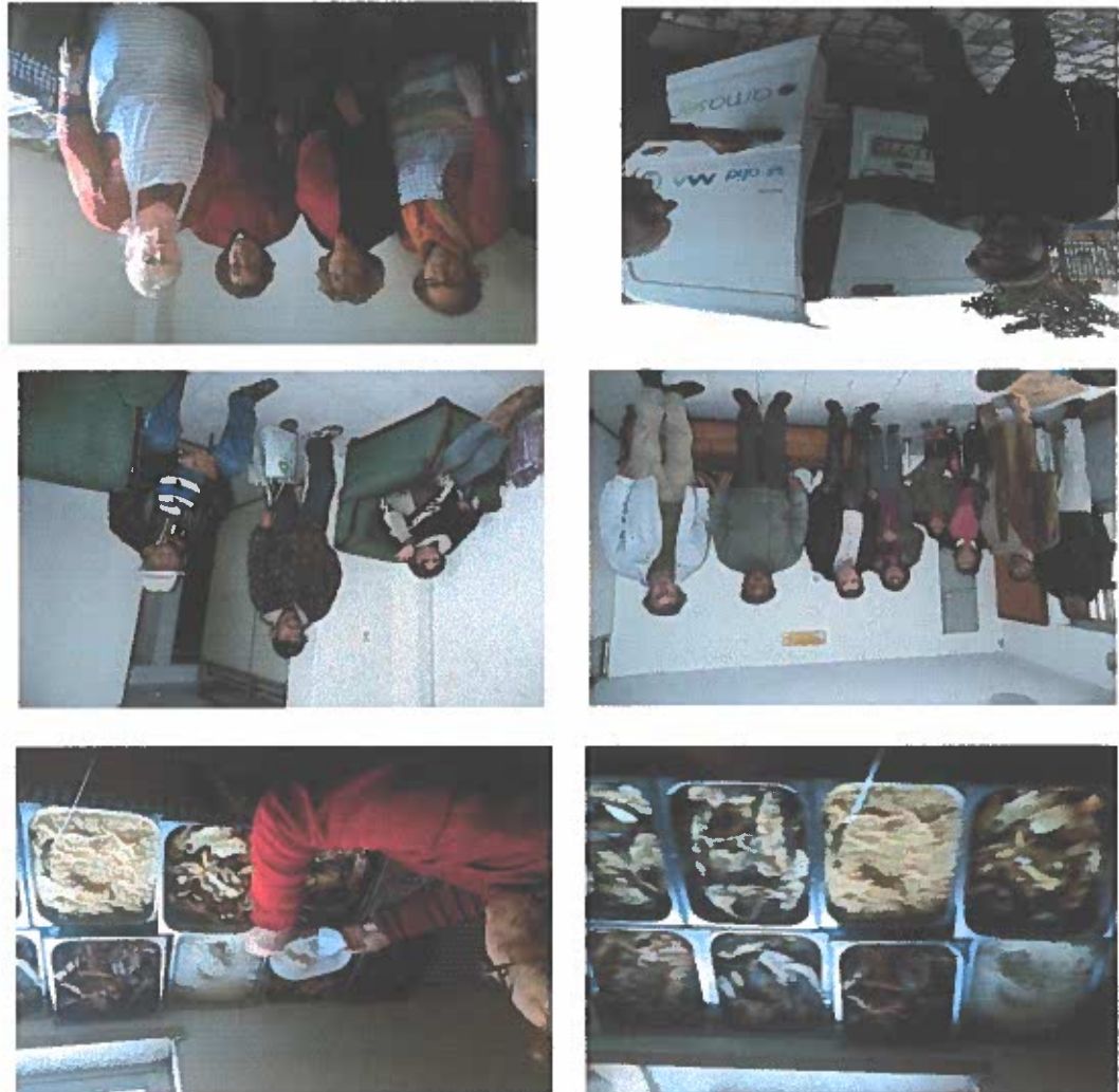
NO REFEITORIO, AS FAMILIAS APOIADAS E VOLUNTARIOS:

"A Partilha" - Associação de moradores do Bairro do Zambujal - Buraca Rua das Minas, Nº 9, Loja B-A 2810-111 Amadora Telfx: 214720592 -