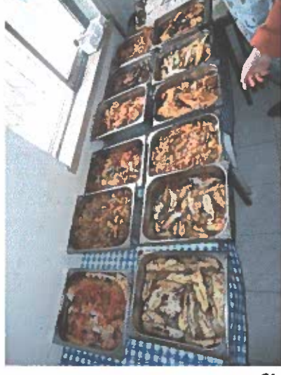
A Partilha - Associação de Moradores do Bairro do Zambujal