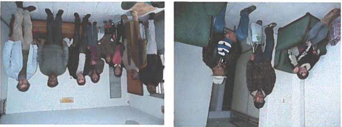
FOTOS NO REFETORIO DE FAMILIAS APOIADAS E VOLUNTARIOS