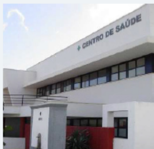
Centro de Saúde Machico