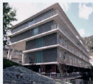
Centro de Saúde Caniço