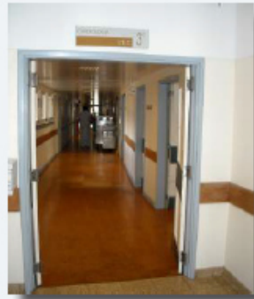
Serviço de Cardiologia