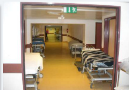
Serviço de Urgência