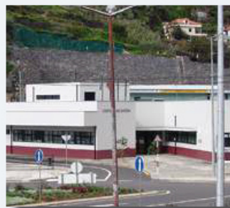
Centro de Saúde Ribeira Brava