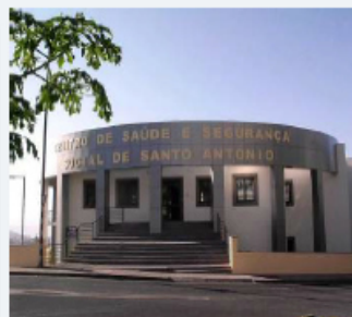
Centro de Saúde Santo António