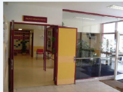
Serviço de Sangue e de Medicina Transfusional