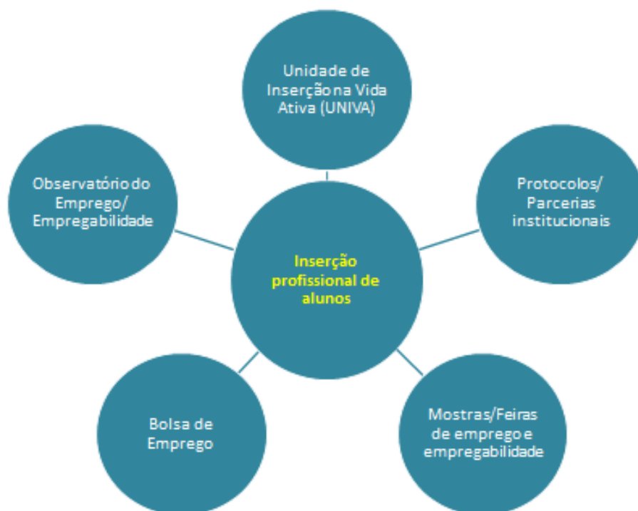
Figura 1.5 - Medidas do processo-chave de Inserção profissional de alunos

De todos, este é o momento/processo-chave das práticas de promoção do sucesso e de combate ao abandono escolar em que, no seu conjunto, as IES públicas evidenciam estar mais atentas, uma vez que têm quase sempre medidas que se inscrevem nas dimensões de análise selecionadas.