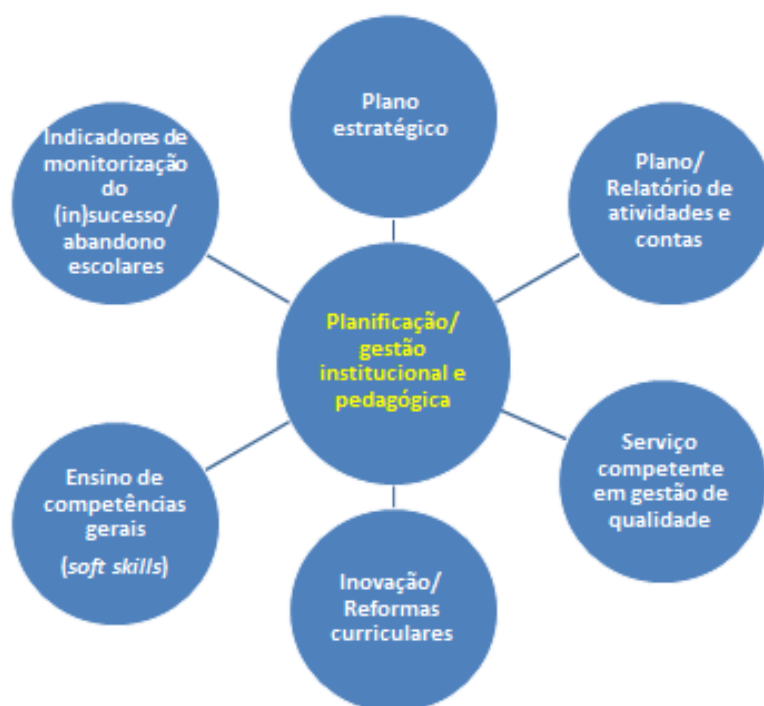
Figura 1.1 – Medidas do processo-chave de Planificação/gestão institucional e pedagógica

A maioria das IES públicas possui planos estratégicos e relatórios de atividade em que o combate ao insucesso e abandono escolares é relevado em orientações ou objetivos estratégicos, ações, indicadores e metas a atingir, assim como no reporte dos resultados alcançados (este, geralmente, no último tipo de documento).