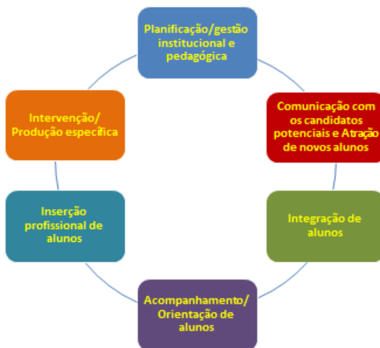
Figura 1 – Processos/Momentos-chave para a promoção do sucesso escolar

Na pesquisa efetuada nos sítios das diversas universidades, politécnicos, institutos, escolas e faculdades, procurou-se identificar e caracterizar os registos sobre cada uma das dimensões destes processos.