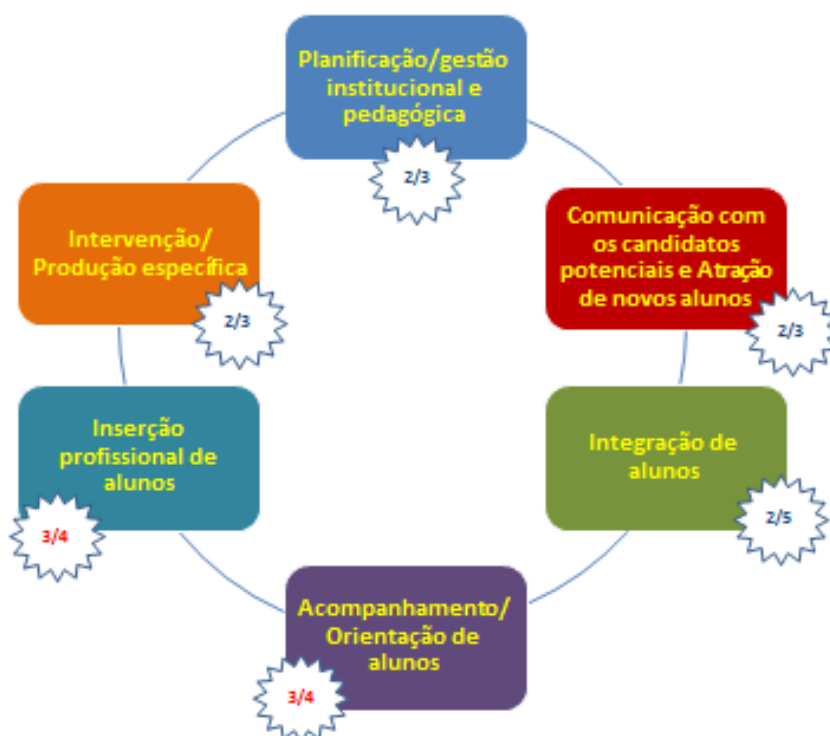
Figura 2 – Registo dos processos-base relevantes para a promoção do sucesso escolar em universidades públicas

Assim, excetuando o momento/processo da integração de alunos , em que só 2/5 das universidades públicas revela medidas próprias, nos restantes momentos a maioria já as apresenta, nomeadamente: