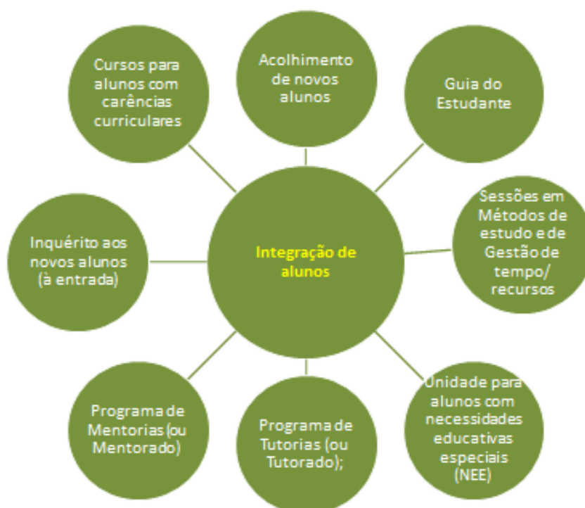
Figura 1.3 - Medidas do processo-chave de Integração de alunos

Em maior ou menor grau, todas as IES desenvolvem atividades para facilitar o período de adaptação ou de inserção dos novos alunos, estejam estes a iniciar um percurso no ensino superior ou sejam provenientes de outras instituições. Estas atividades são modeladas em função do tipo de alunos e do seu regime de acesso e têm maior incidência nos primeiros meses ou ano de frequência (salvo algumas que se prolongam ao longo do ciclo de estudos).