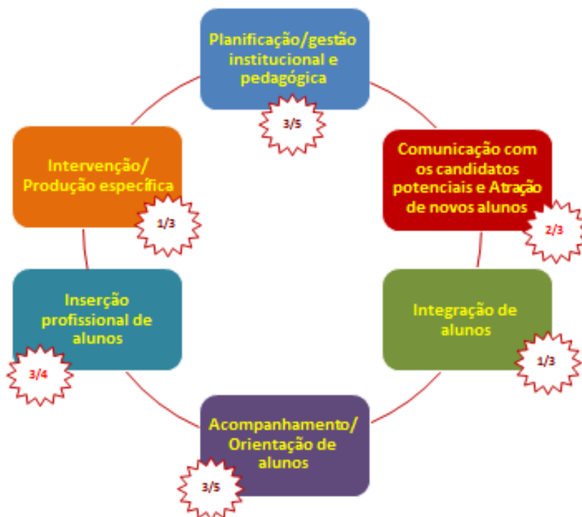
Figura 3 - Registo dos processos-base relevantes para a promoção do sucesso escolar em politécnicos públicos

A inserção profissional de alunos é também o momento-chave mais relevante no subsistema do ensino politécnico público (4/5 dos casos) e os menos relevantes são o de integração de alunos e de intervenção/produção específica (ambos 3/10 dos casos). Os outros três momentos considerados voltam a mostrar o protagonismo maioritário dos politécnicos públicos: (pouco) mais de metade relativamente à planificação/gestão institucional e pedagógica , 3/5 no respeitante ao acompanhamento/orientação de alunos e 2/3 quanto à comunicação/atração de alunos .