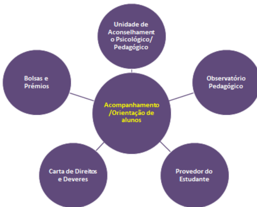
Figura 1.4 - Medidas do processo-chave de Acompanhamento/Orientação de alunos

Ainda que os programas de tutoria e mentoria sejam essencialmente dispositivos de integração de alunos, são também instrumentos de acompanhamento e orientação, tanto mais relevantes nestas funções quanto maior for a sua duração no percurso escolar daqueles. De facto, tal como a mentoria, “a tutoria visa o desenvolvimento pessoal e social, académico e profissional que vá para além da escolarização, munindo o aluno de competências e de empowerment que lhe permitam aprender ao longo da vida.” (Semião, 2009: 55-56).