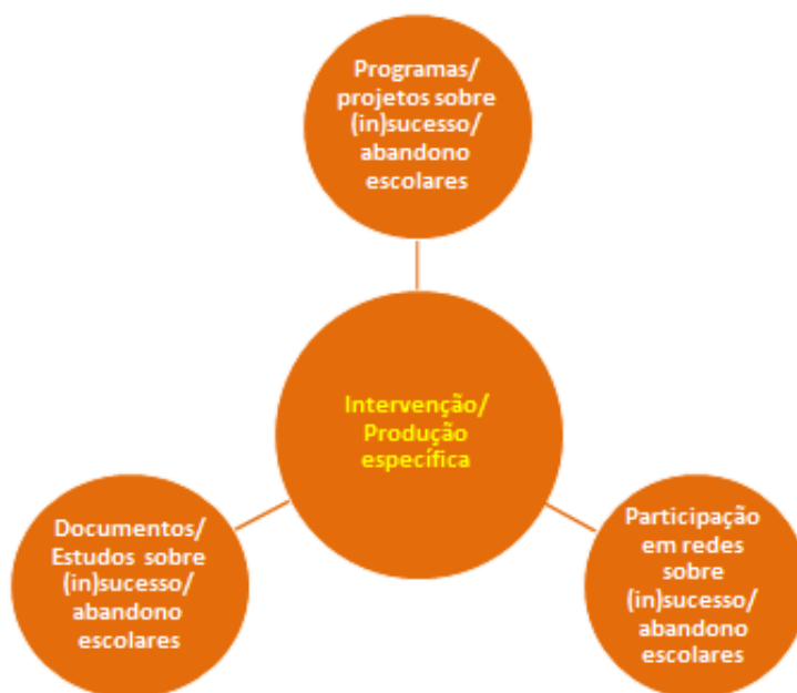
Figura 1.6 - Medidas do processo-chave de Intervenção/Produção específica

Nos processos/momentos-chave anteriores foi feita a inventariação e a caracterização sumária das dimensões com impacte mais relevante no combate ao insucesso e abandono escolares, bem como a avaliação da importância que lhes é atribuída por parte das IES públicas. Importa, ainda, destacar quais destas têm uma intervenção mais direta sobre o problema.