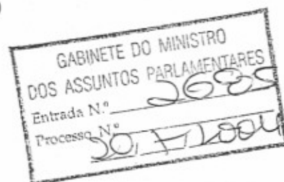
(Nuno Peres Alves)