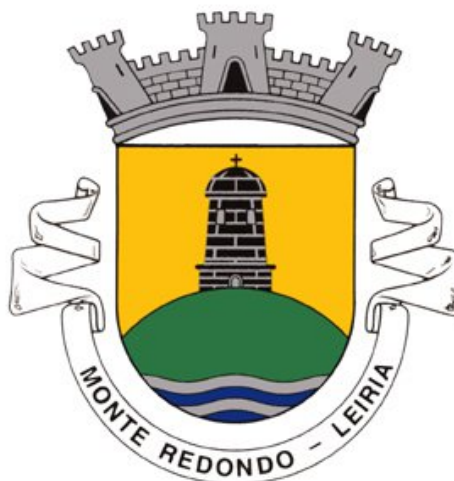
Figura 1 – Brasão da freguesia de Monte Redondo