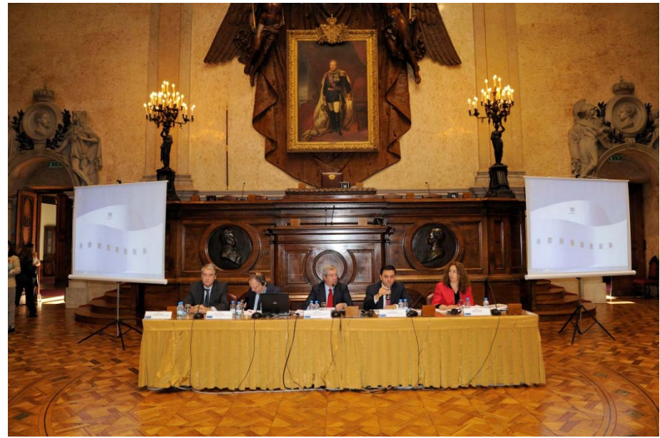
Recepção aos Participantes