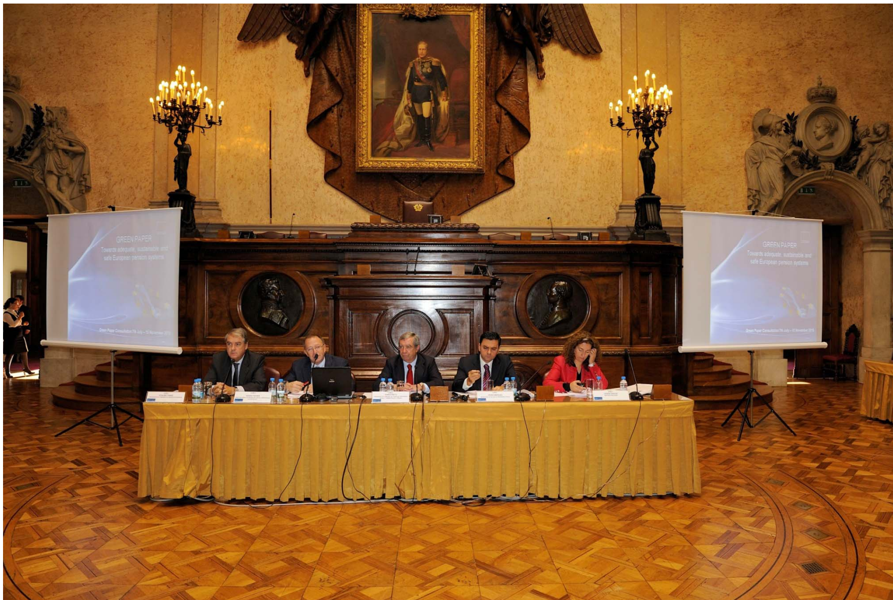
Panorâmica geral / General View