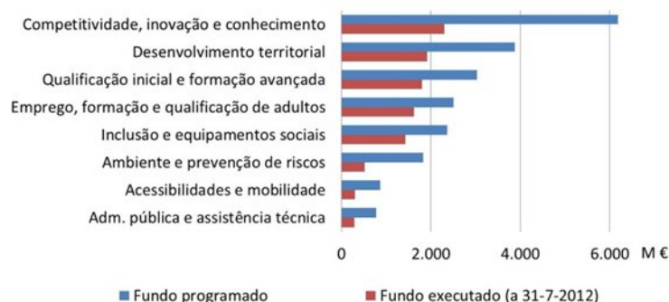
Gráfico 5.2 - Execução do QREN (a 31 de julho de 2012) por domínio de investimento