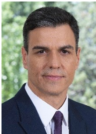
Presidente do Governo: Primeiro-Ministro, Pedro Sánchez (desde junho de 2018), líder do Partido Socialista Operário Espanhol (PSOE)..

O Governo de Pedro Sánchez enfrenta importantes desafios, como a questão das autonomias, em especial no que se refere à Catalunha e a gestão da imigração no Mar Mediterrâneo.