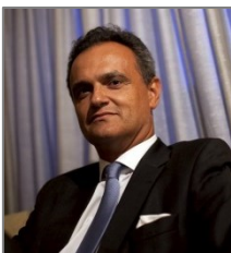
Embaixador Extraordinário e Plenipotenciário: Embaixador Francisco Ribeiro de Menezes

Embaixada em Madrid Calle Lagasca, 88 – 4ª A 28001 MADRID Tel. 0034917824960 E-mail: madrid@mne.pt www.madrid.embaixadaportugal.mne.pt