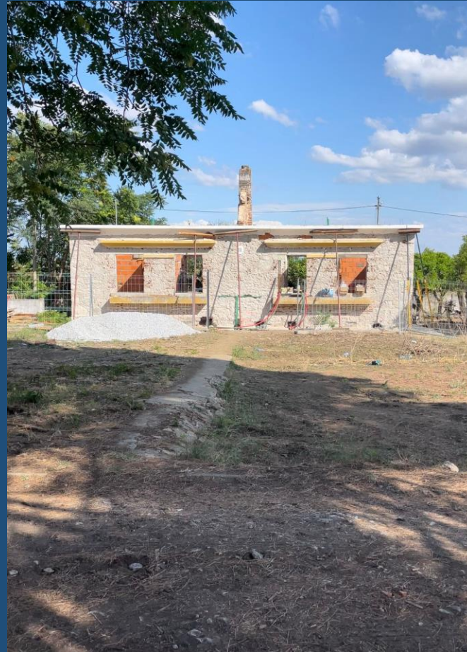
Bairro de Almeirim

(INFRAESTRUTURAS DE PORTUGAL) PARQUE PÚBLICO A CUSTOS ACESSÍVEIS