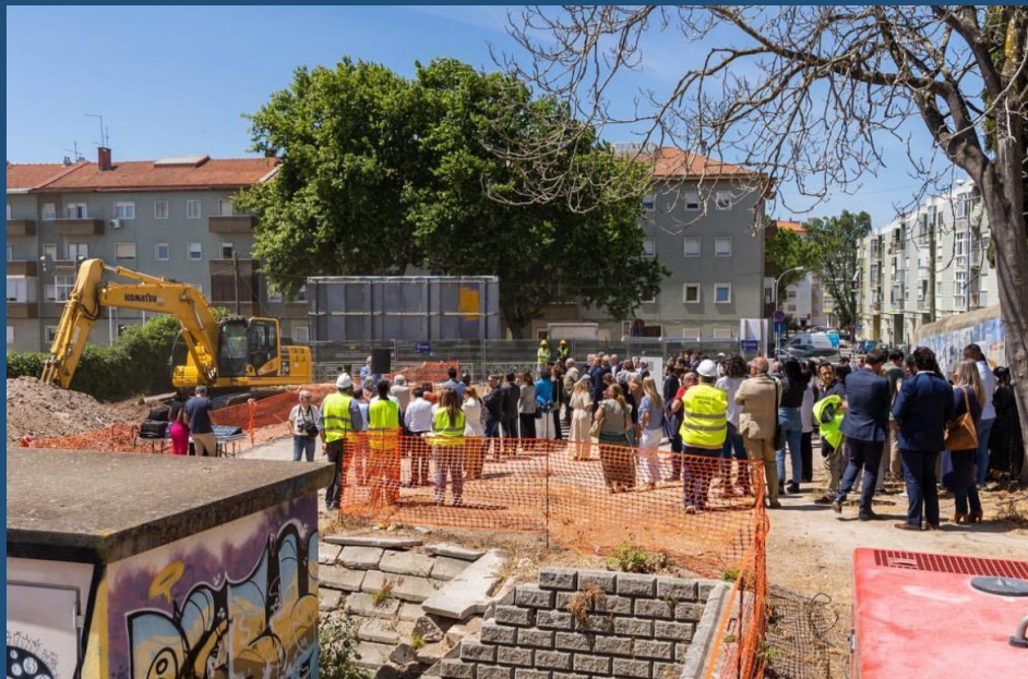
1ª Pedra da Quinta dos Aciprestes Construção de 12 habitações