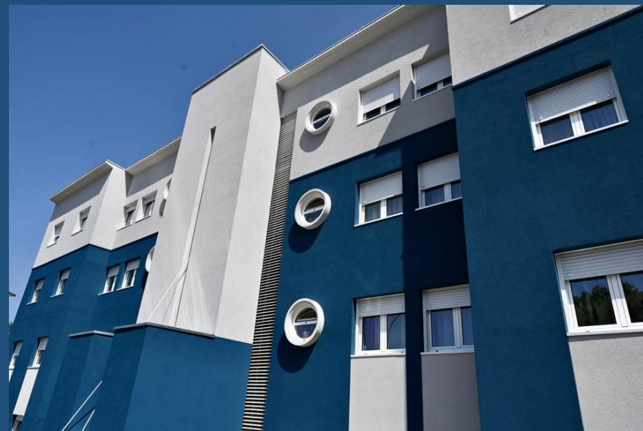
Bairro Laveiras Reabilitação de 16 habitações