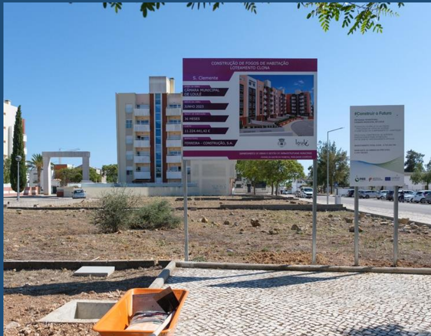
Primeira Pedra do projeto da Clona – 30 fogos