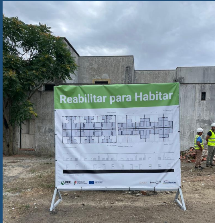
Bairro da Malagueira – 12 habitações