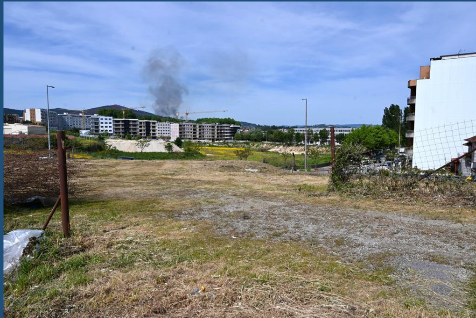
Terreno para construção de projeto habitacional