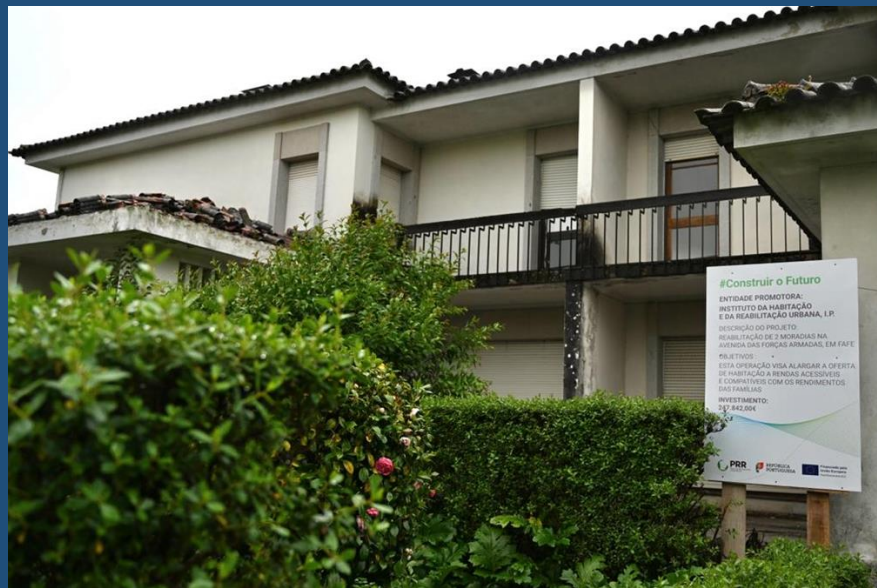
Fafe: em empreitada