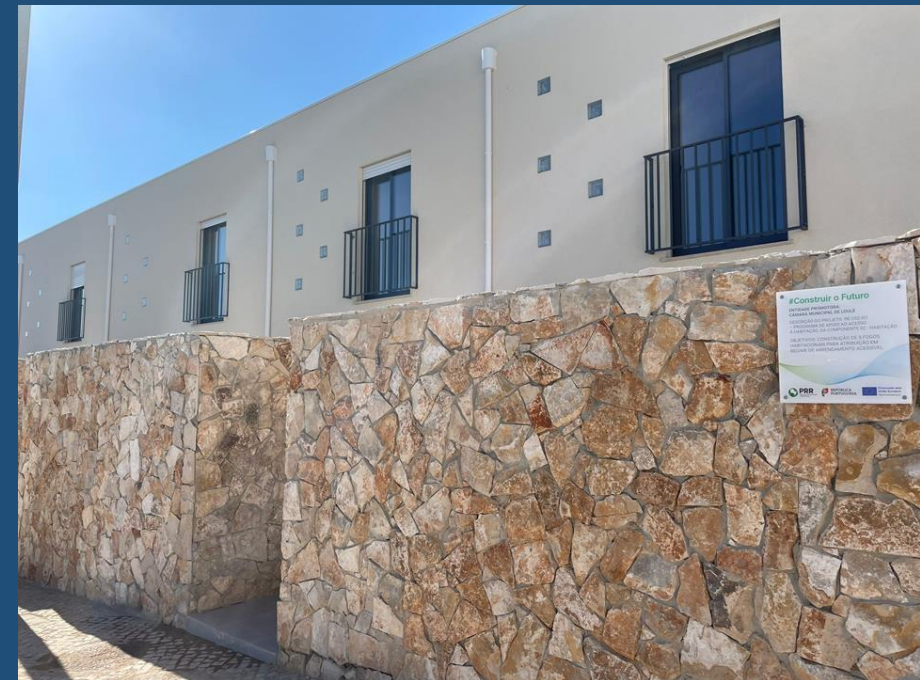
Salir - Cinco moradias unifamiliares