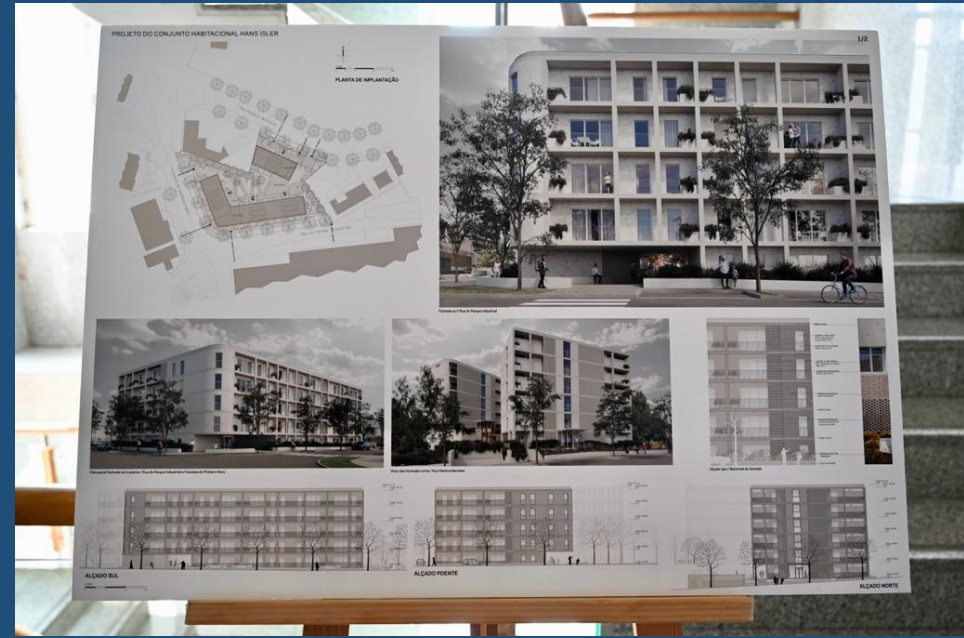
Projeto das 45 habitações