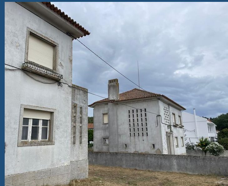
Arraiolos: em projeto