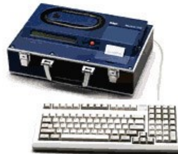
7110 Alcotest MK III-C