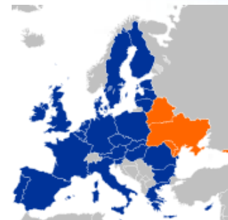
Cimeira da Parceria Oriental 28 – 29 Novembro