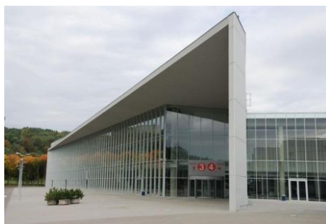
LITEXPO 3 encontros de alto nível