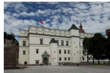
Palácio dos Soberanos Jantares de gala e programa cultural