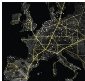
Conferência de alto nível sobre a Energia 4 – 5 Novembro