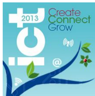
ICT2013 6 – 8 Novembro