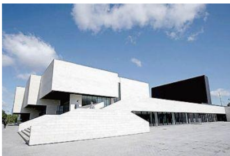
Galeria Nacional de Arte 14 Conselhos Informais