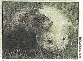
Spray foi testado em furões

❑ Cientistas testaram com êxito em furões um spray que bloqueia o coronavírus no nariz e nos pulmões. É esperado agora que o tratamento seja estudado em humanos. A investigação cabe a cientistas das universidades de Colúmbia e de Cornell, nos EUA, e do Centro Médico da Universidade Erasmus, Holanda. ●