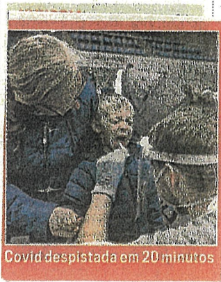
Covid despistada em 20 minutos