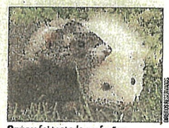
Spray foi testado em furões

❑ O regulador nacional de produtos médicos da China aprovou dois kits de teste de antígeno que podem detetar a Covid e fornecer resultados em 20 minutos. Desenvolvidos por duas empresas de biotecnologia em Guangzhou e Pequim, são os primeiros testes de antígeno aprovados no país para o coronavírus. ●