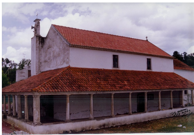
Capela Nossa Senhora da Conceição – Século XVI