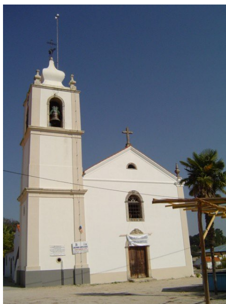
Antiga Igreja Paroquial – Templo Quatrocentista

A igreja, alterada em épocas sucessivas, apresenta pinturas e azulejos seiscentistas, azuis e brancos dos tipos enxequetado e padrão. Contém imaginária do séc. XV ao séc. XVIII, e talha dourada setecentista. Actualmente está em recuperação do estado vetusto e desleixado em que se encontrava. A par, situa-se nova igreja matriz, de cunho moderno.