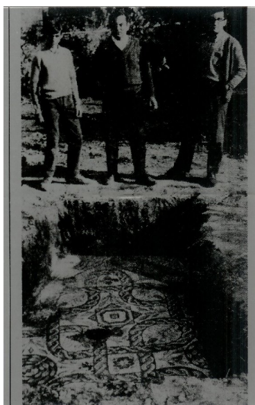
Vila Romana no Olival – Descoberta em 1972

Para além de objectos paleolíticos encontrados que levam a crer que o Olival era já povoado na pré-história, identificaram-se por duas vezes distintas em meados do séc. XX, mesmo no centro da povoação do Olival e num raio de cem metros, uma ou mais vilas romanas, com destaque para mosaicos do séc. III valiosos e bem conservados, bem como ainda vestígios de calçada romana.