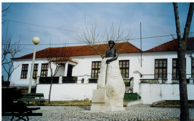
Escola do 1.º Ciclo de Olival e Busto Capitão Joaquim Vieira Justo

Creche/Jardim-de-infância e ATL; Escola Básica do 1.º ciclo;