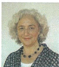
Ms Farah KARIMI

Member - Committee on Foreign Affairs, Defence and Development Cooperation