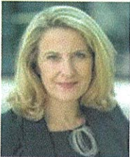
Ms Heike RAAB

Member - Committee on European Union Questions of the Bundesrat