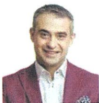
Mr Krzysztof GAWKOWSKI

Member - Committee on Digitalisation, Innovation and Modern Technologies