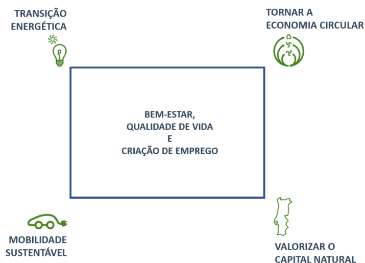
FIGURA 1 – PILARES DE AÇÃO POLÍTICA DO PROGRAMA AMBIENTE

É, neste contexto, que os pilares da nossa ação política exigem uma atuação focada na descarbonização, através da transição energética , da mobilidade sustentável , da economia circular e da valorização do capital natural, do território e das florestas , promovendo iniciativas facilitadoras desta transição como o financiamento sustentável, a fiscalidade verde e a educação ambiental.