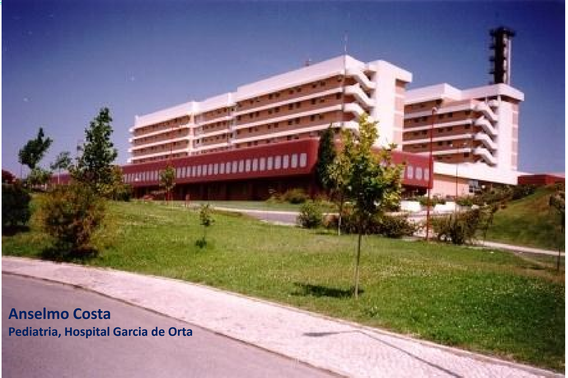
Anselmo Costa Pediatric, Hospital Garcia de Orta