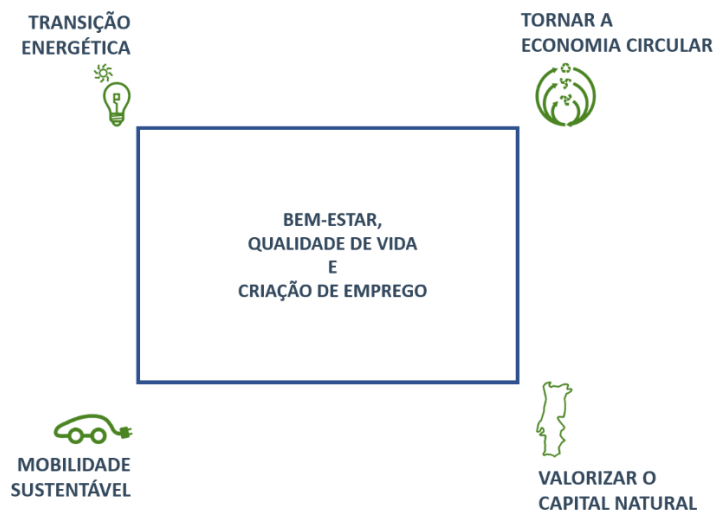
FIGURA 1 – PILARES DE AÇÃO POLÍTICA DO PROGRAMA AMBIENTE

É esta opção estratégica que importa agora prosseguir, reforçar e executar, nesta legislatura, com a inclusão de medidas centradas na ação climática e numa nova visão sobre criação de riqueza e sustentabilidade.