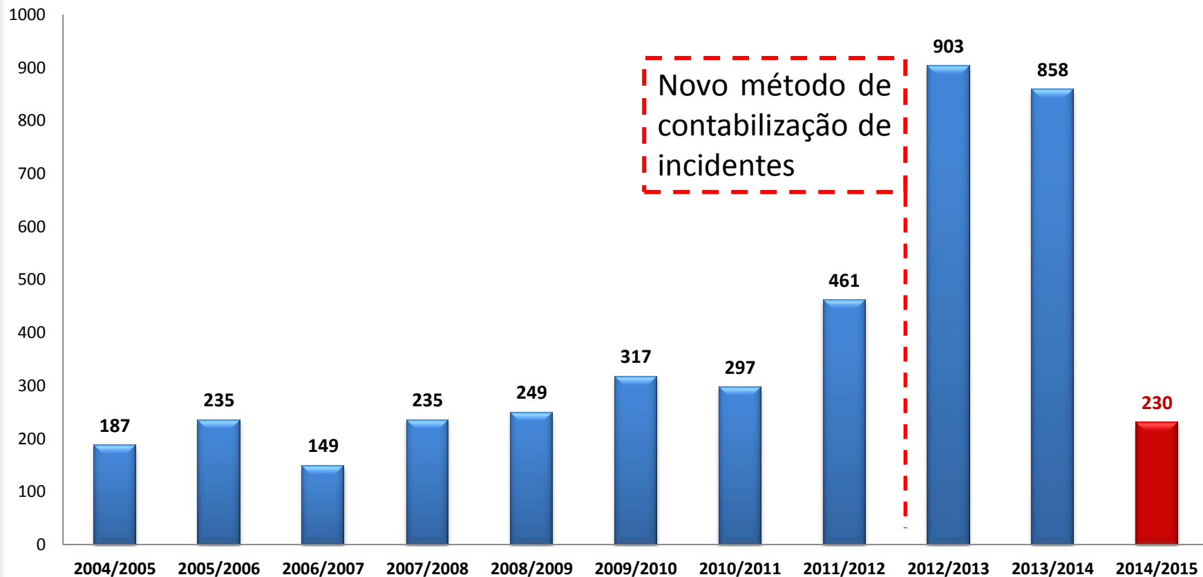
Evolução do número de incidentes nas últimas 10 épocas