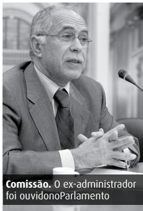
Comissão. O ex-administrador foi ouvido no Parlamento

“Foi uma reunião difícil de ouvir, em que a questão nucle-