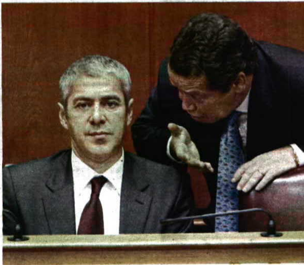
Para o Executivo de Sócrates estes projectos estimulam a economia