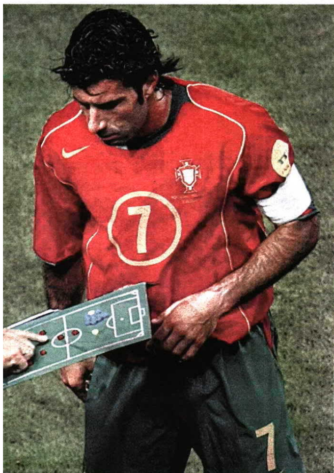
Scolari e Figo foram duas das caras associadas ao BPN

que as Finanças podem aspirar é pouco mais de 20 milhões de euros, tendo em conta o preço indicativo dos contratos de futuros da prata. As oscilações em relação a esse valor dependerão da evolução do mercado internacional da matérias-primas-prata.