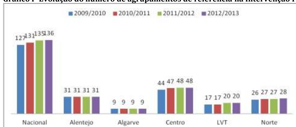
Gráfico I- Evolução do número de agrupamentos de referência na Intervenção Precoce