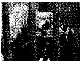
Contra o Abate do Pitbull Zico