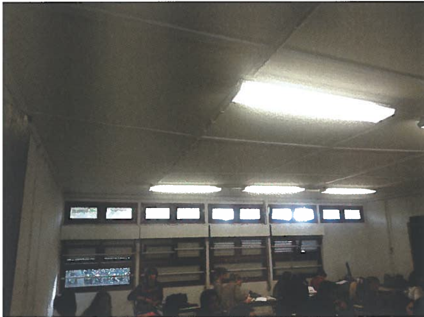
Ilustração 3 - sala 31