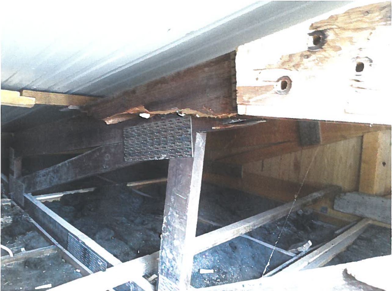
Ilustração 2 - Sala 34

O abaulamento visível na ilustração 1 decorre da quebra de uma perna da asna registada na ilustração 2. Foi possível proceder a este registo devido ao levantamento de uma telha na cobertura do pavilhão. Não existindo iminência de colapso imediato da cobertura, sugere-nos o princípio da prevenção e da precaução (Lei de Bases da Proteção Civil), que se atue preventivamente de modo a evitar a geração de danos (colocação de prumos até à resolução definitiva da situação).