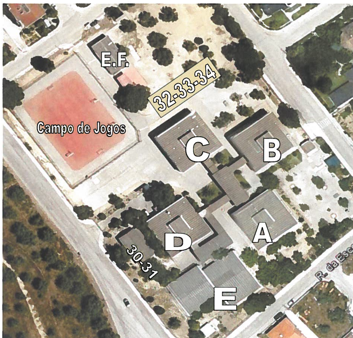
Imagem da Escola EB 2.3 de Azeitão