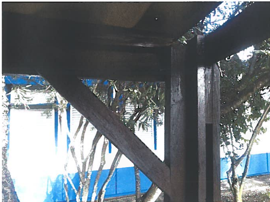
Ilustração 6 - Avançado (salas 30 e 31)