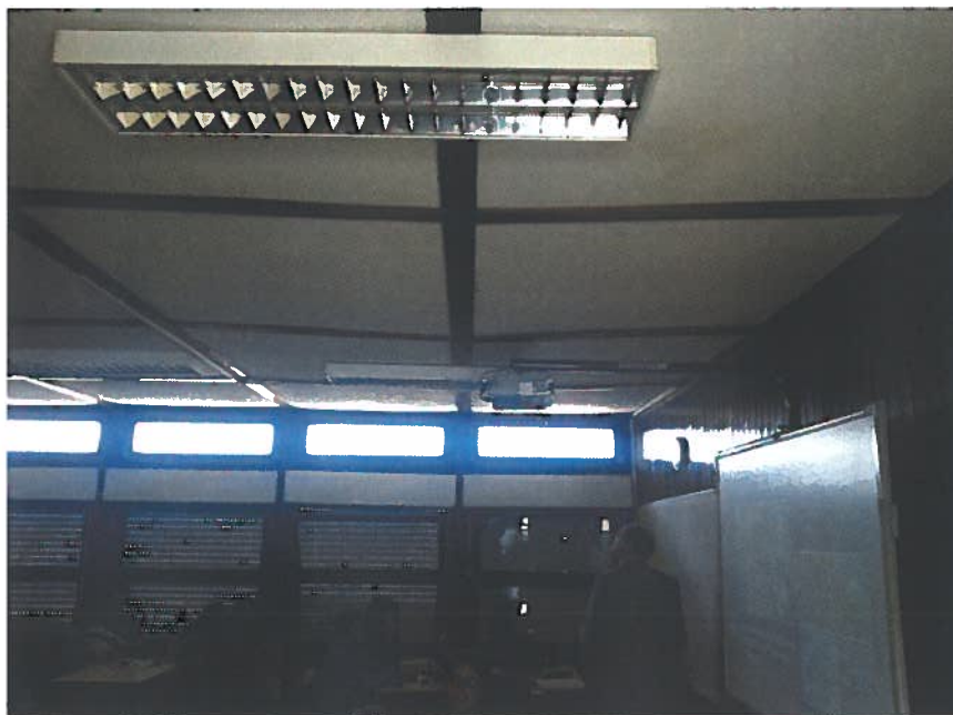
Ilustração 1 - Sala 34

Esta proposta sustenta-se no registo fotográfico infra, registado na sala 34: