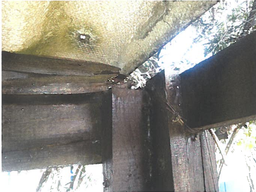
Ilustração 5 - Avançado (salas 30 e 31)