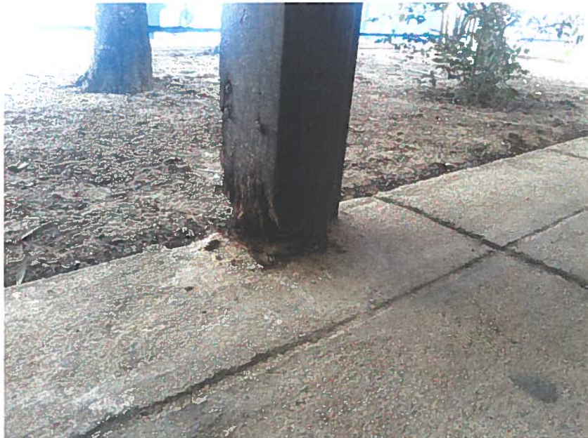
Ilustração 4 - Prumo do avançado (salas 30 e 31)