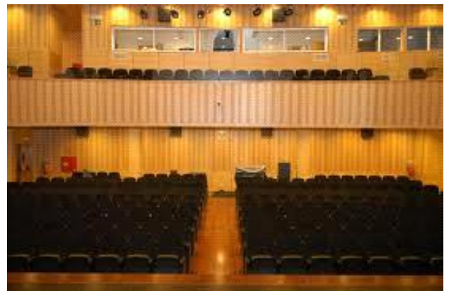
Fig.2 cine-teatro João Mota, Sesimbra

O círculo eleitoral de Setúbal possui agora no seu projeto de recomendação 4 medidas fortes e irrefutáveis, que são fruto do esforço que as 12 escolas presentes tiveram ao longo destes meses para assim encontrar uma escapatória a todos os jovens deste país que não incluía uma mudança de endereço.