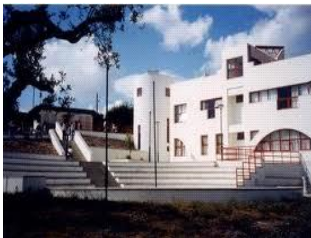
figura 1. Escola secundária de Palmela

" Uma viagem política com início nesta escola e com o fim de mudar o rumo do nosso país"