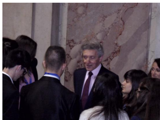
Fig. 8 A conferência de Imprensa

Já passou uma hora e o debate está agora concentrado na Recomendação à Assembleia sobre o tema;