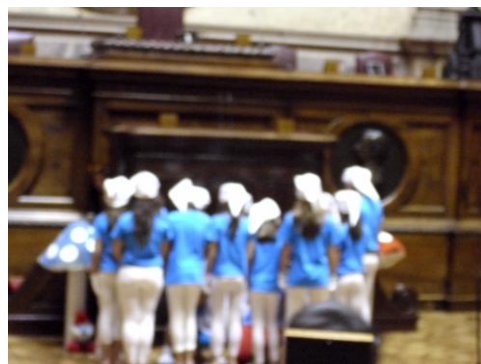
Fig. 6 Dança os “smurfs”

O sol começa a pôr-se mas no palácio de S. Bento ninguém pensa em descansar, são 18h00min e o Agrupamento de Escolas de Águas Santas apresenta um grupo de dança misto com “pequenos e graúdos” que interpretam vários temas sendo um deles a música dos smurfs; a sala do senado nunca teve tanta animação, e entre palmas e sorrisos os deputados descomprimiram de todo o stressse que haviam passado na sala das comissões.