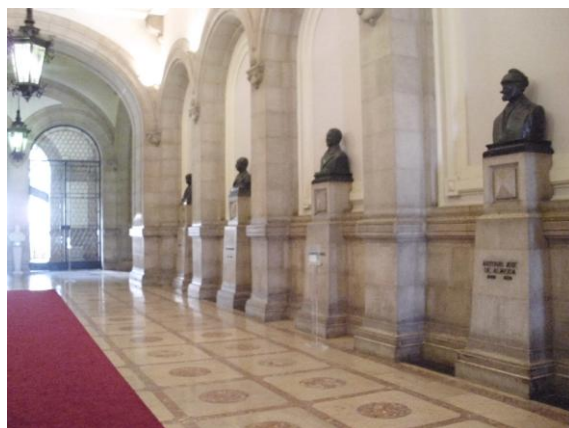
Fig. 9 a sala dos presidentes