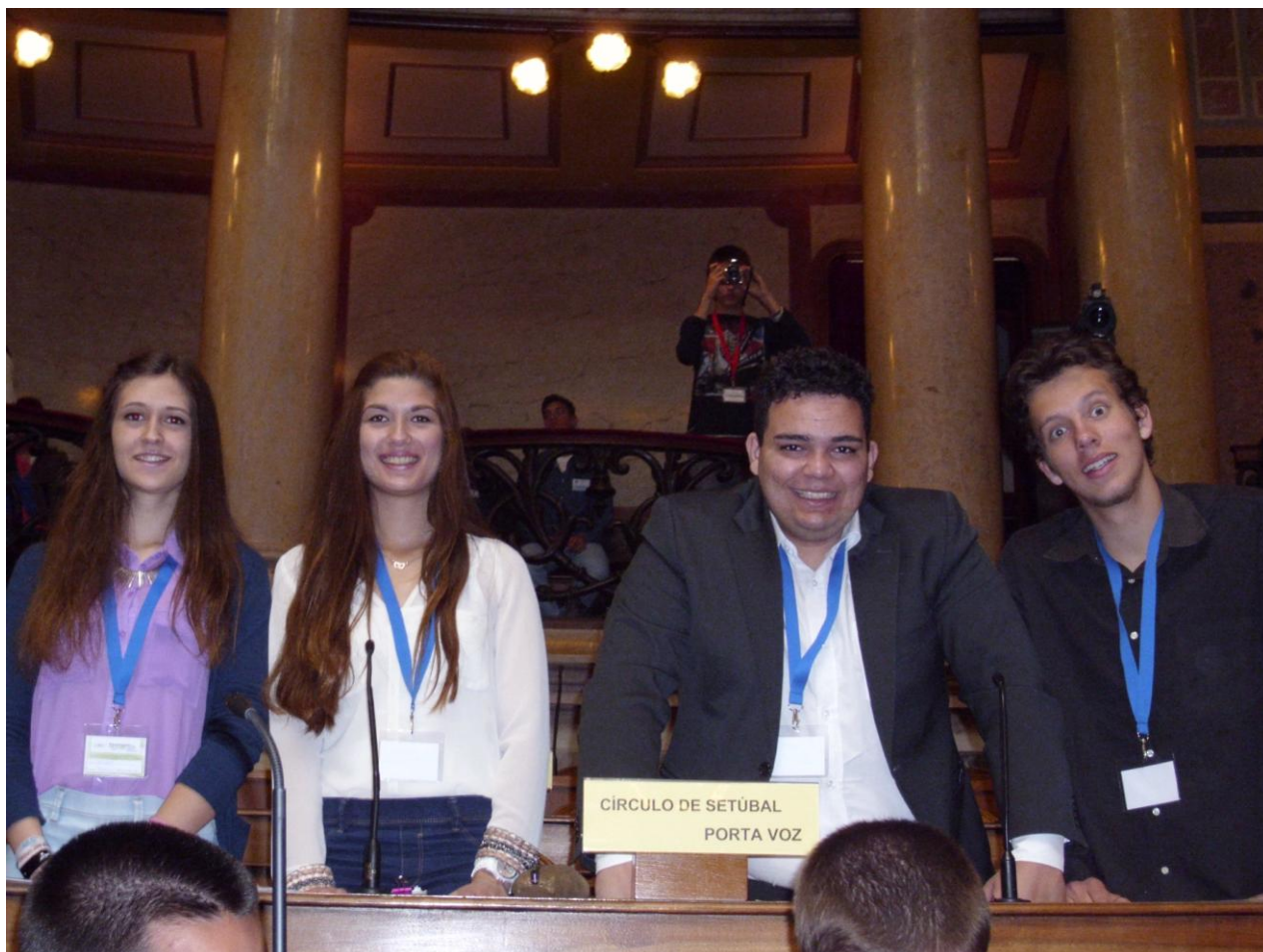
Fig. 7 Círculo eleitoral de Setúbal