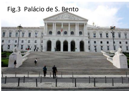
Fig.3 Palácio de S. Bento

Dia 27 de maio de 2013, chegados ao palácio de S. Bento, os deputados depararam-se com inúmeras escadas que foram interpretadas como o grande caminho que teriam de percorrer para alcançar o pretendido; mas sem medos ou afrontas dirigiram-se para a entrada que agora se dividia em duas (a porta principal para os deputados e outra para os repórteres e professores) e caminharam por entre o palácio até à divisão das comissões.