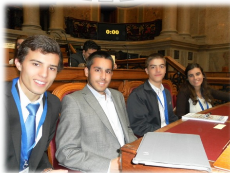
Círculo de Santarém

Pelas 13 horas, após a apresentação das propostas de eliminação, passou-se à aprovação ou retratação das mesmas, balançando entre momentos de intervenção a favor ou contra uma eliminação e respetivas votações. Anunciou-se o resultado final: foram apuradas medidas que apostavam na potencialização do setor primário, na atribuição de benefícios fiscais a empresas, e outras 8 que podem ser consultadas no endereço: