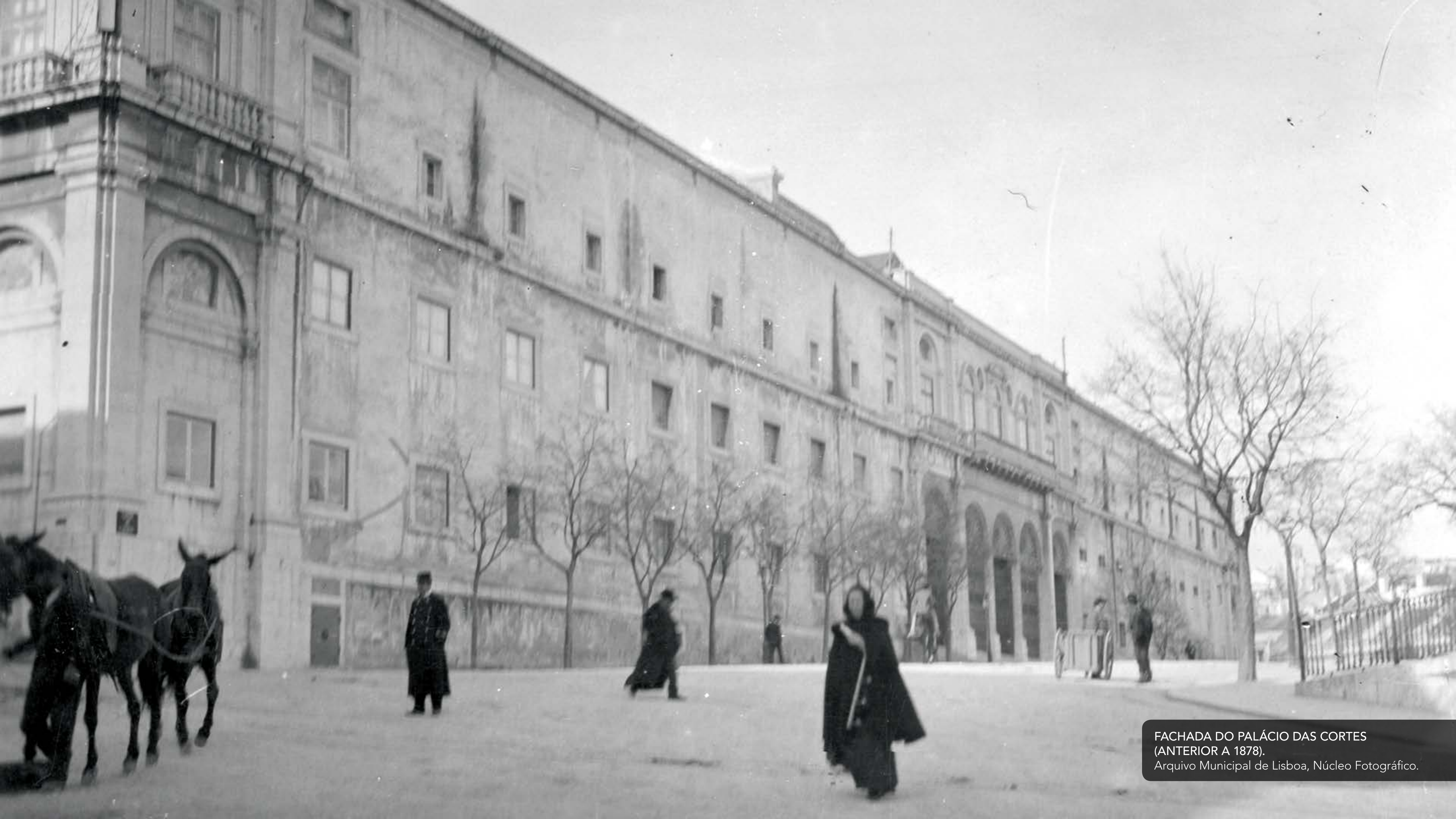
FACHADA DO PALÁCIO DAS CORTES (ANTERIOR A 1878).