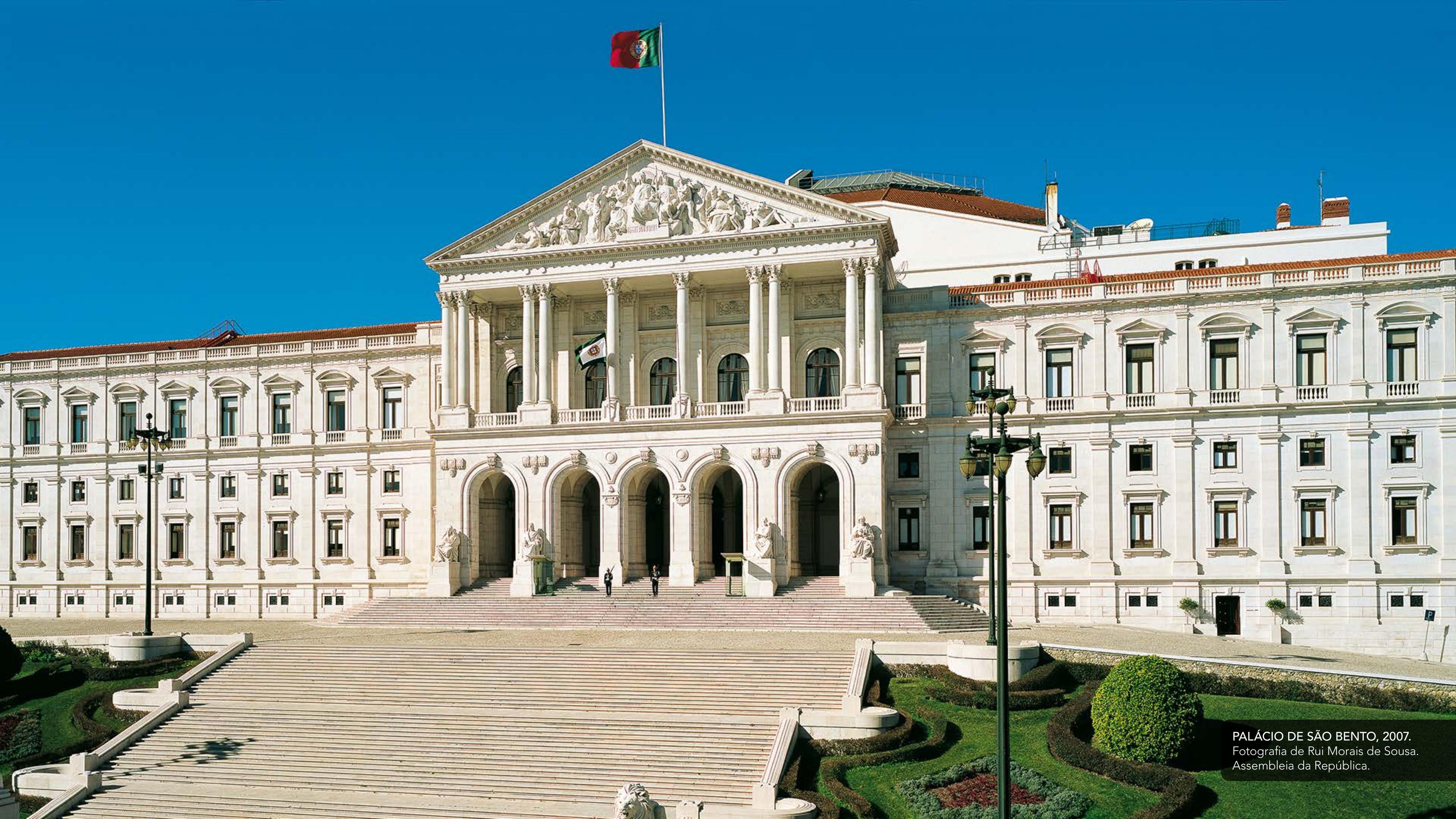
PALÁCIO DE SÃO BENTO, 2007. Fotografia de Rui Morais de Sousa. Assembleia da República.