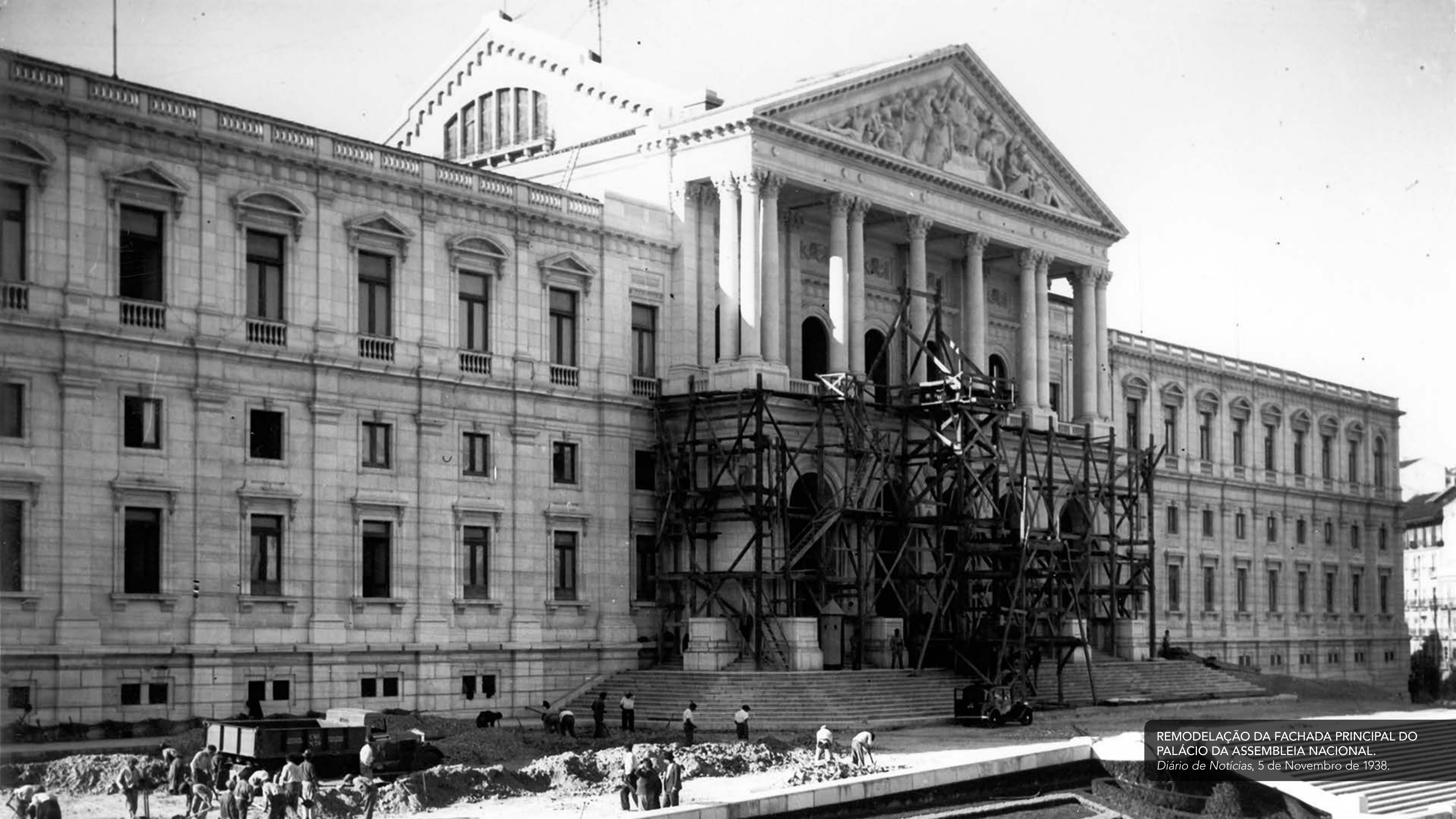
REMODELAÇÃO DA FACHADA PRINCIPAL DO PALÁCIO DA ASSEMBLEIA NACIONAL. Diário de Notícias , 5 de Novembro de 1938.