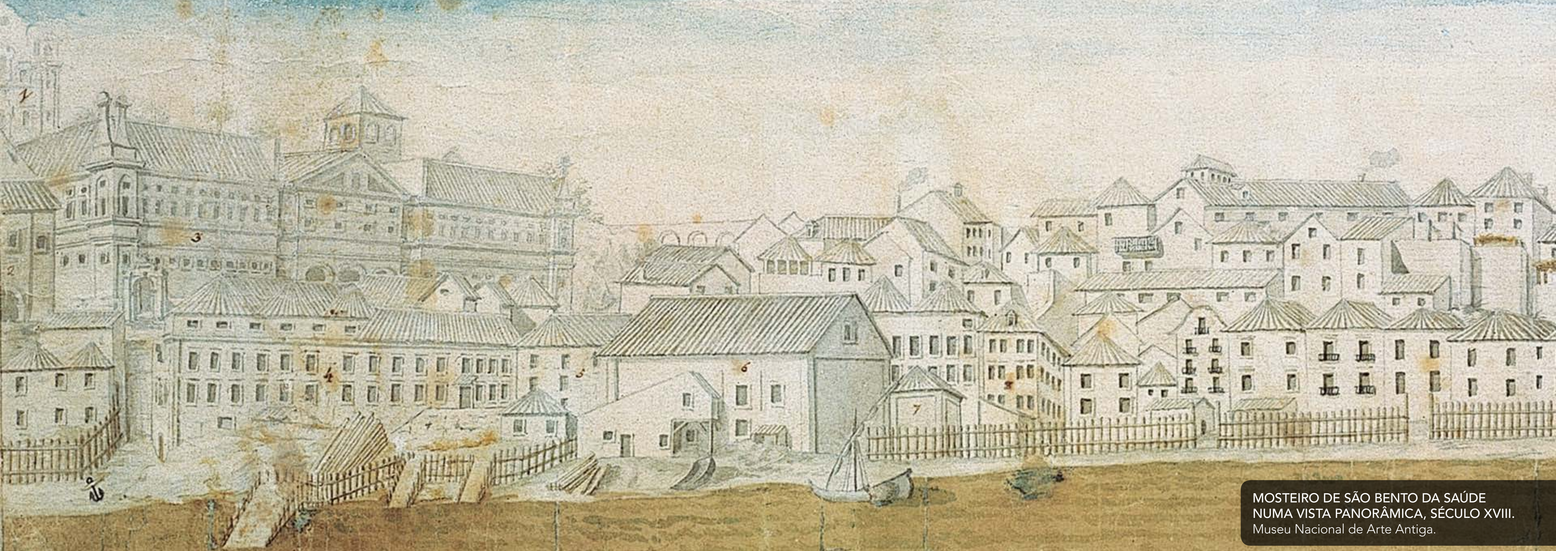
MOSTEIRO DE SÃO BENTO DA SAÚDE NUMA VISTA PANORÂMICA, SÉCULO XVIII. Museu Nacional de Arte Antiga.