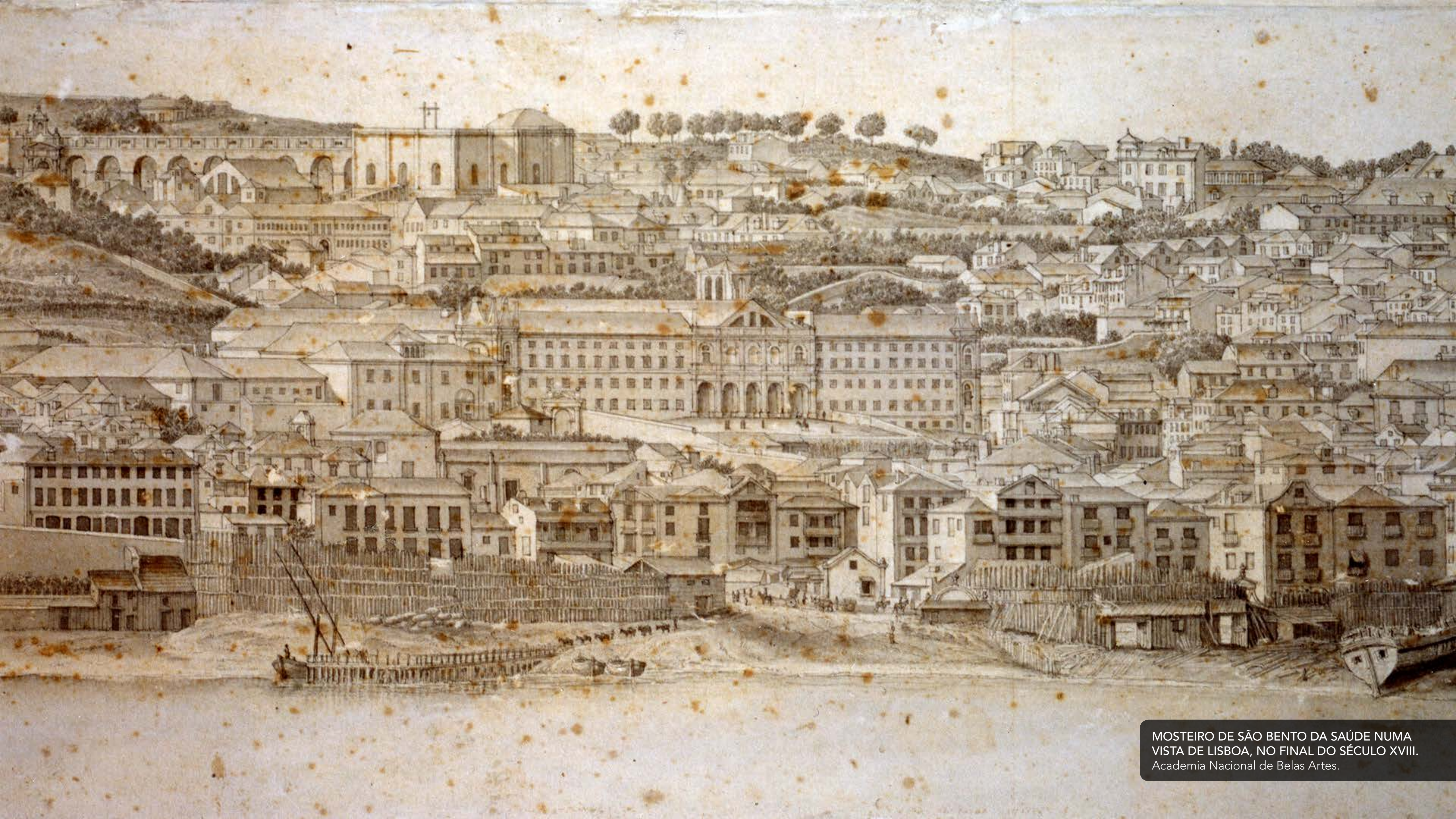
MOSTEIRO DE SÃO BENTO DA SAÚDE NUMA VISTA DE LISBOA, NO FINAL DO SÉCULO XVIII. Academia Nacional de Belas Artes.