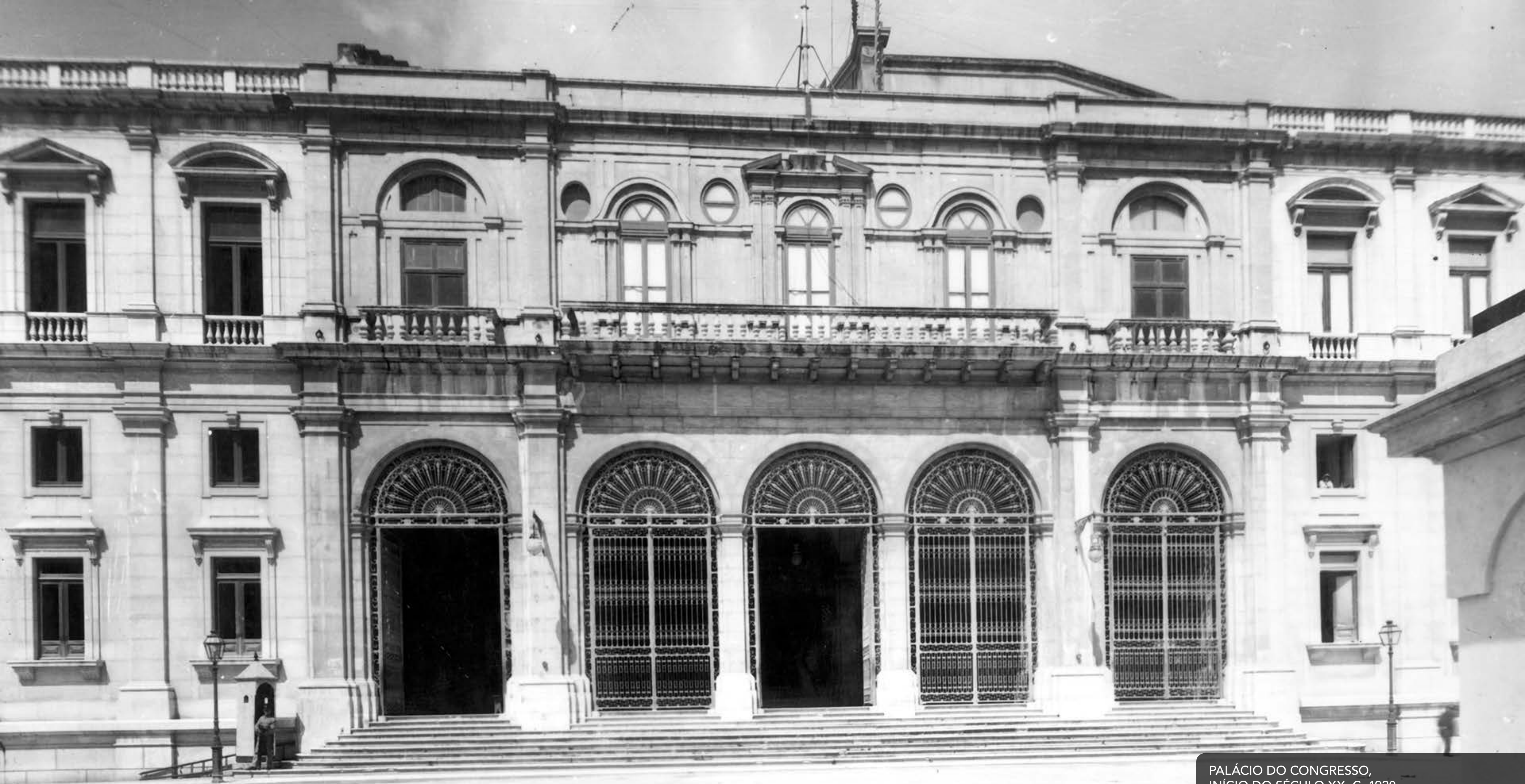
PALÁCIO DO CONGRESSO, INÍCIO DO SÉCULO XX, C. 1920.