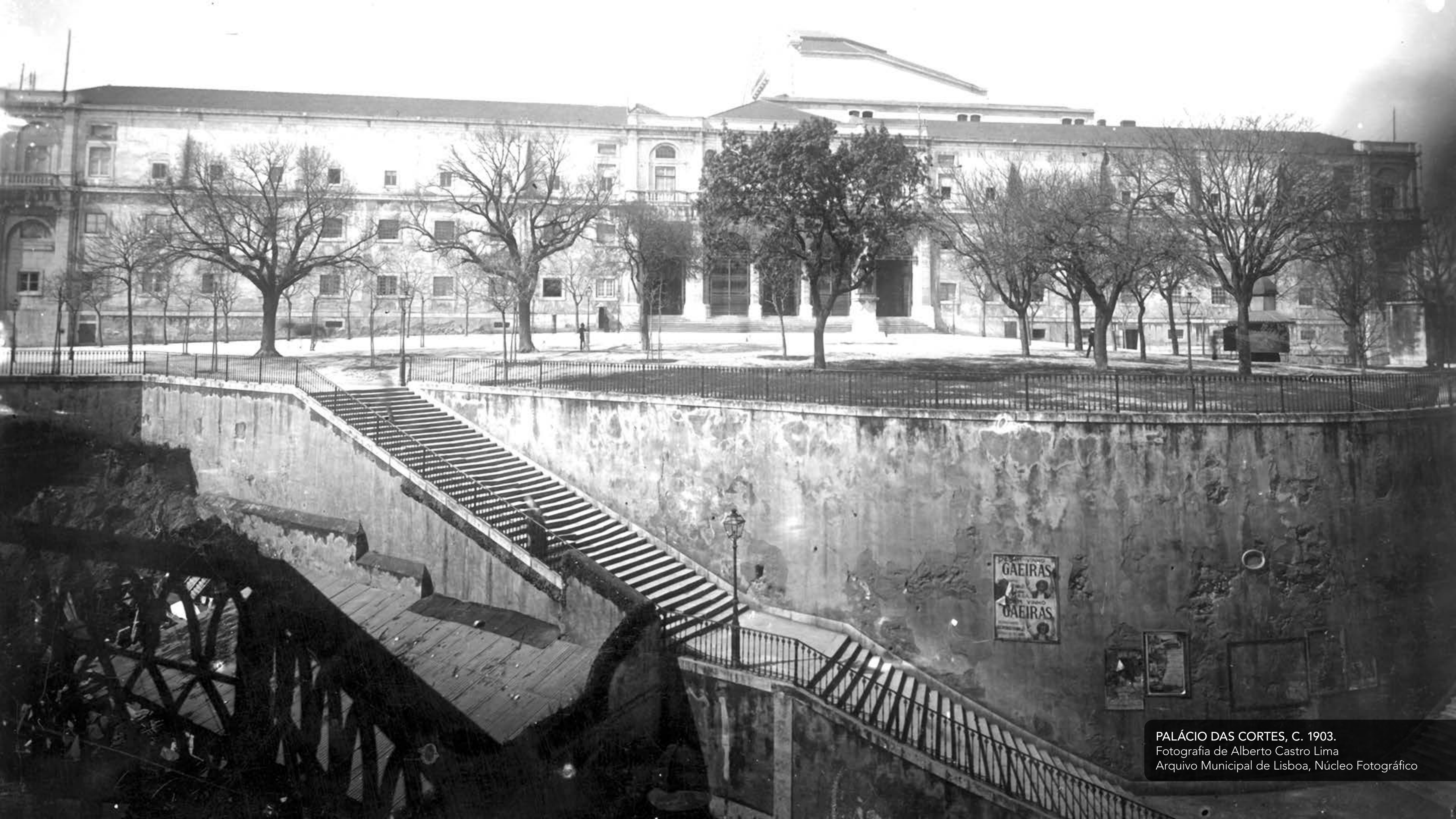
PALÁCIO DAS CORTES, C. 1903.