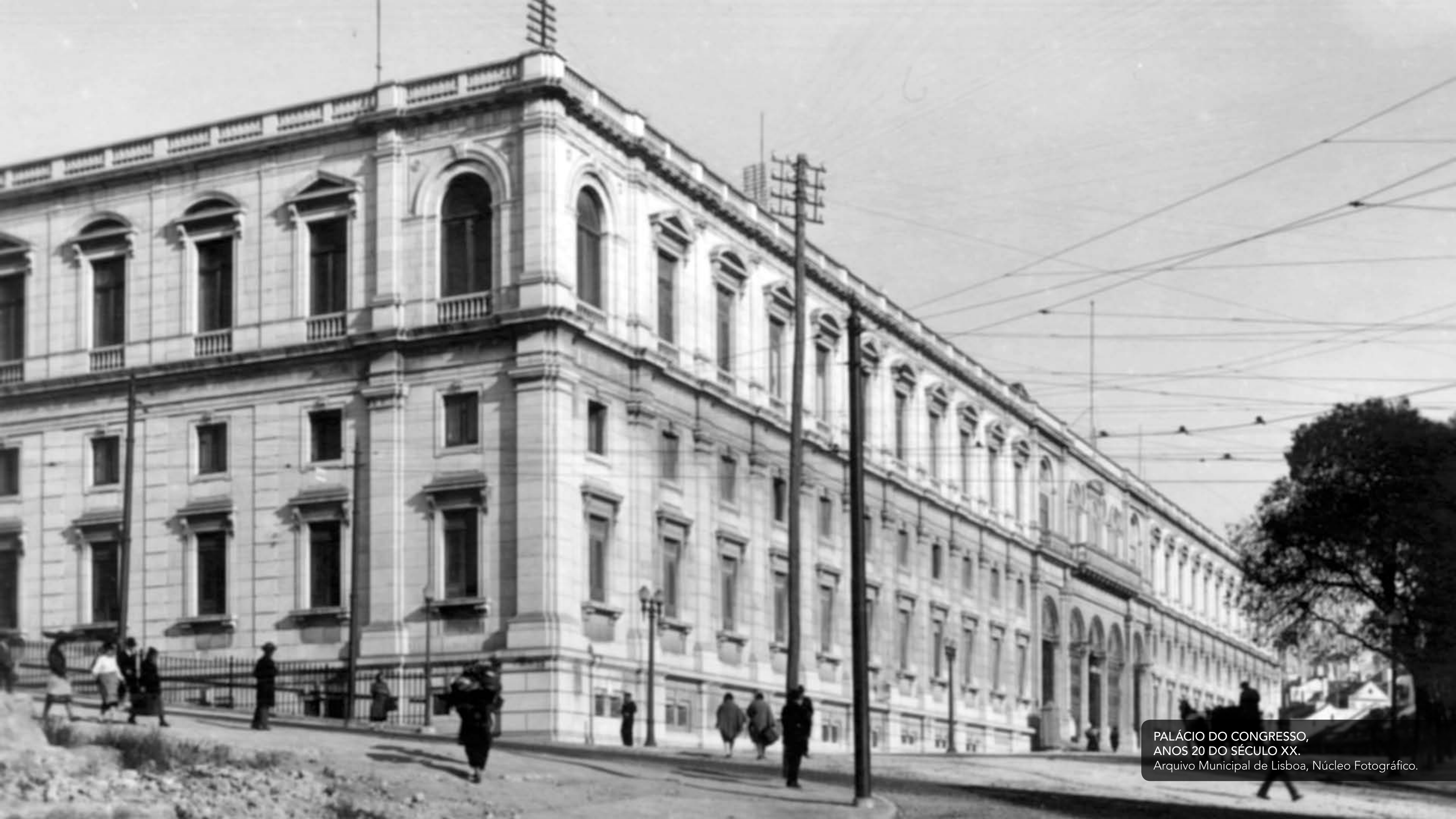
PALÁCIO DO CONGRESSO, ANOS 20 DO SÉCULO XX.