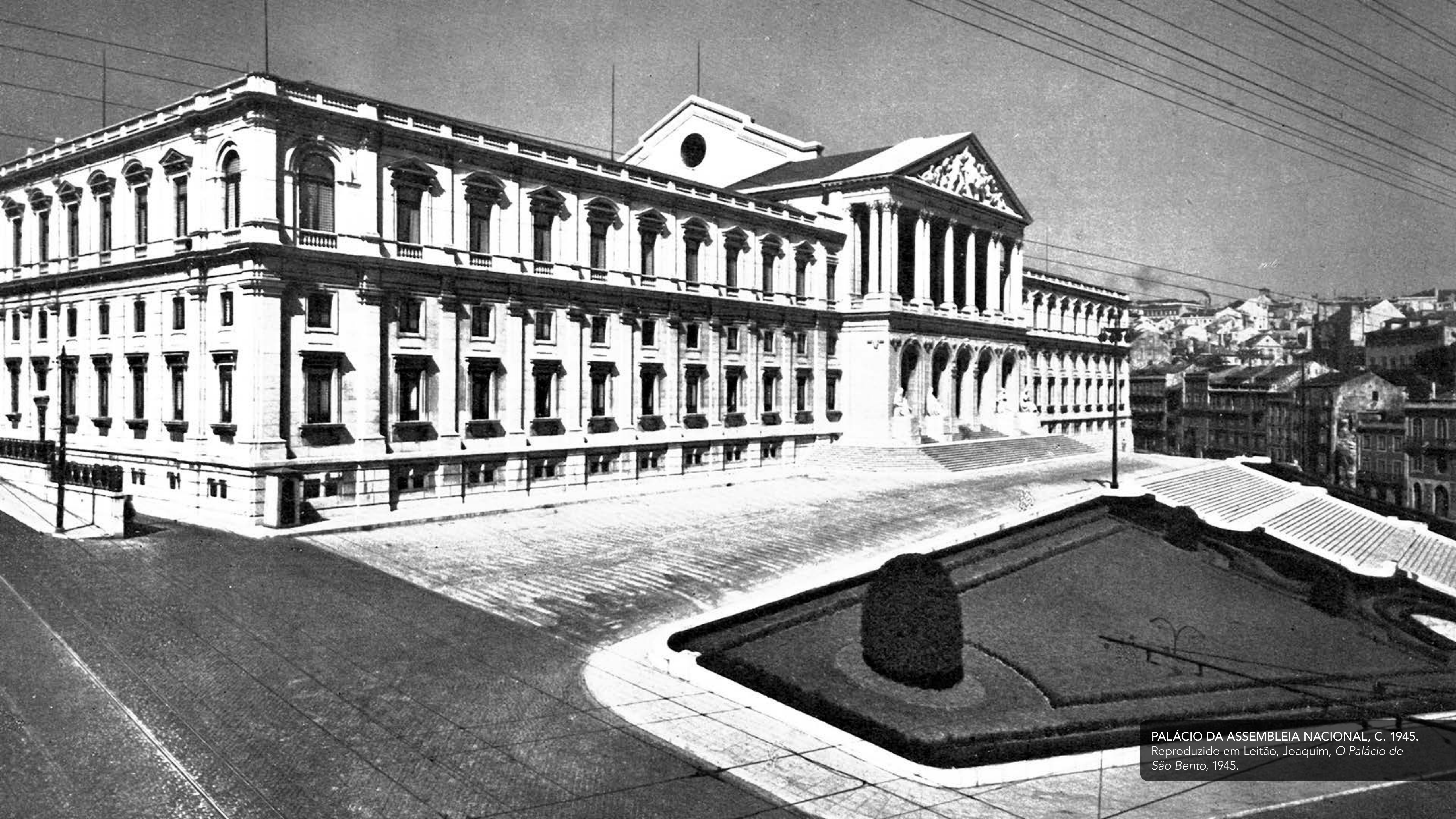
PALÁCIO DA ASSEMBLEIA NACIONAL, C. 1945. Reproduzido em Leitão, Joaquim, O Palácio de São Bento , 1945.