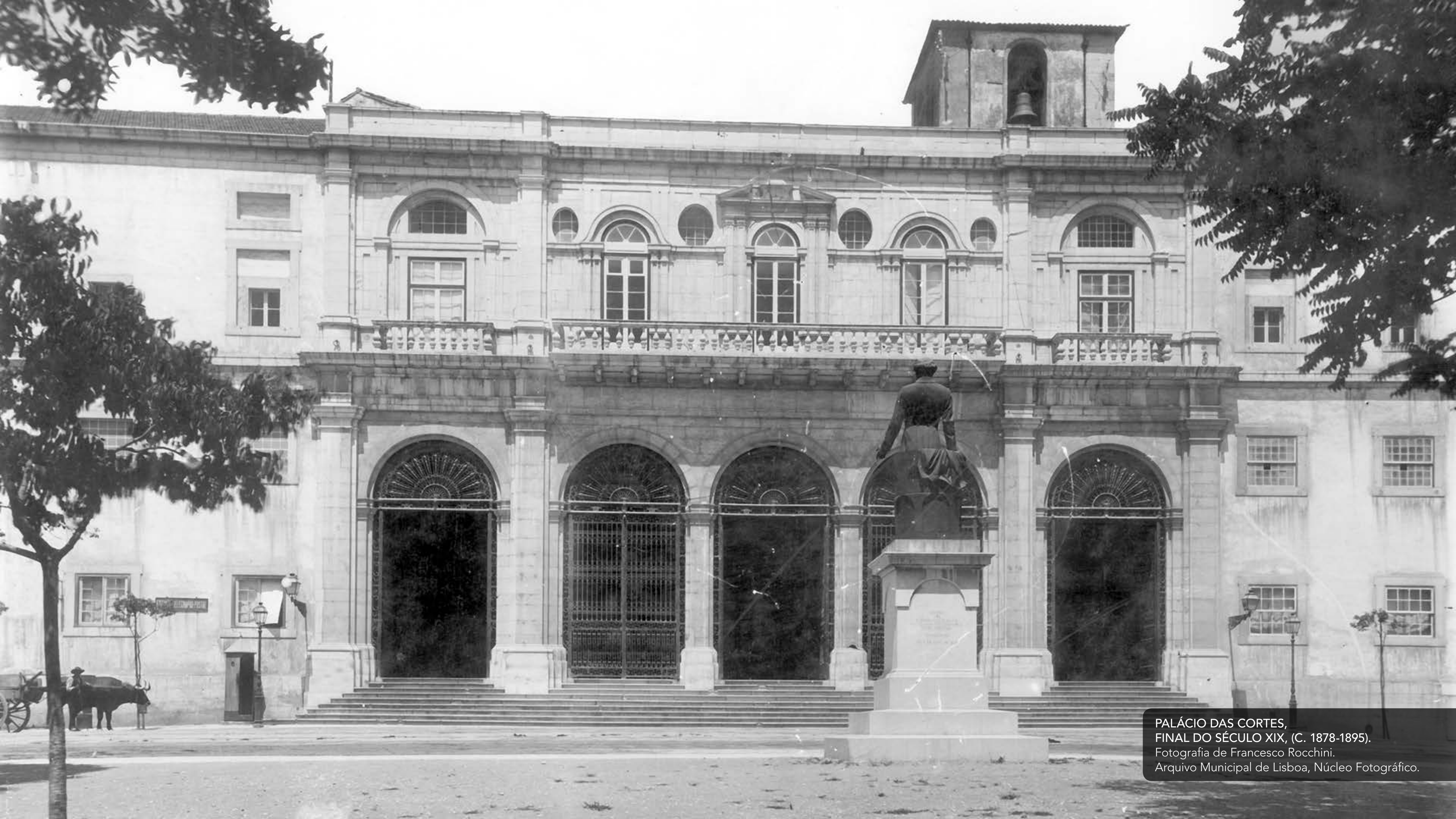
PALÁCIO DAS CORTES, FINAL DO SÉCULO XIX, (C. 1878-1895).