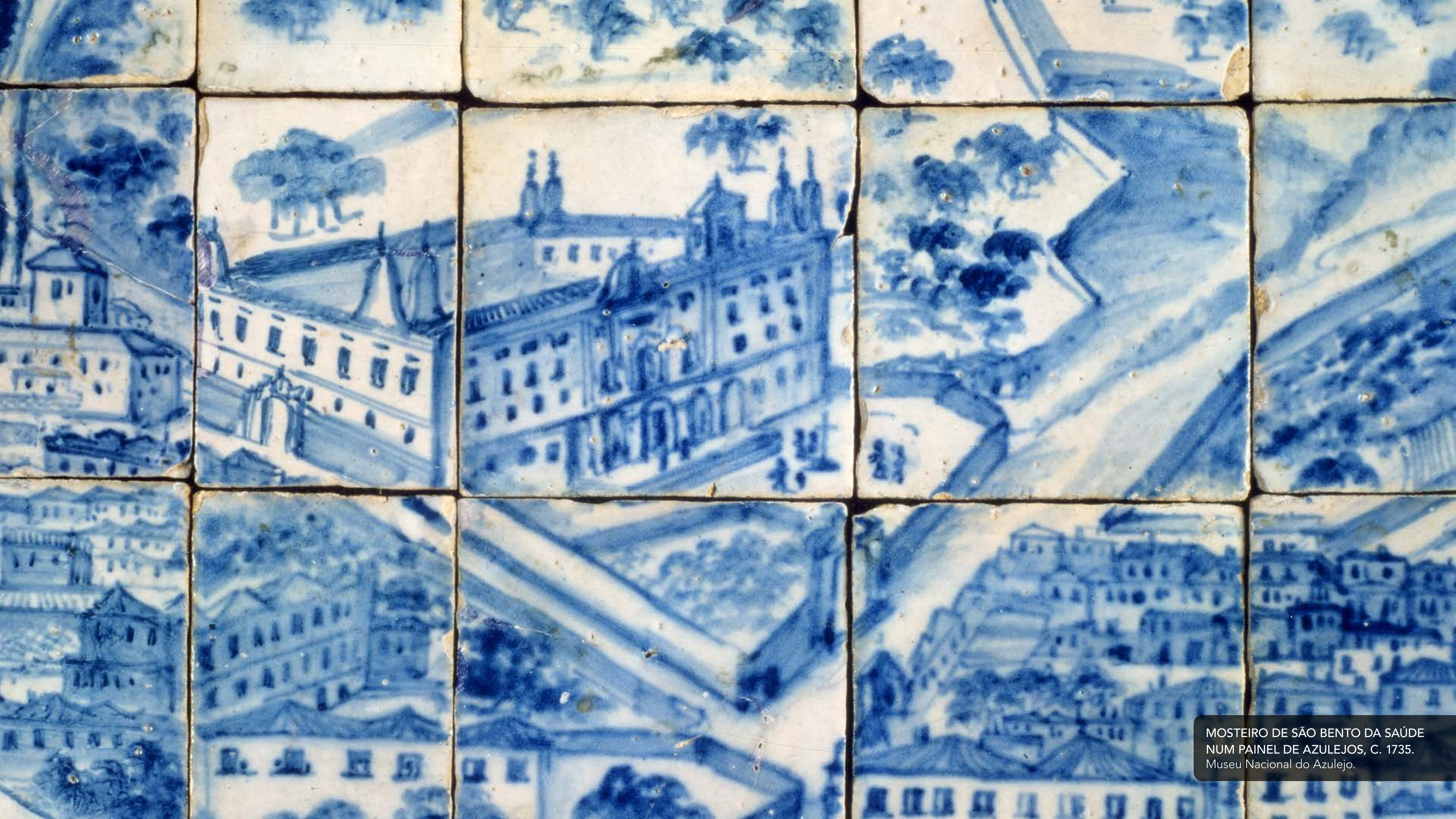
MOSTEIRO DE SÃO BENTO DA SAÚDE NUM PAINEL DE AZULEJOS, C. 1735. Museu Nacional do Azulejo.