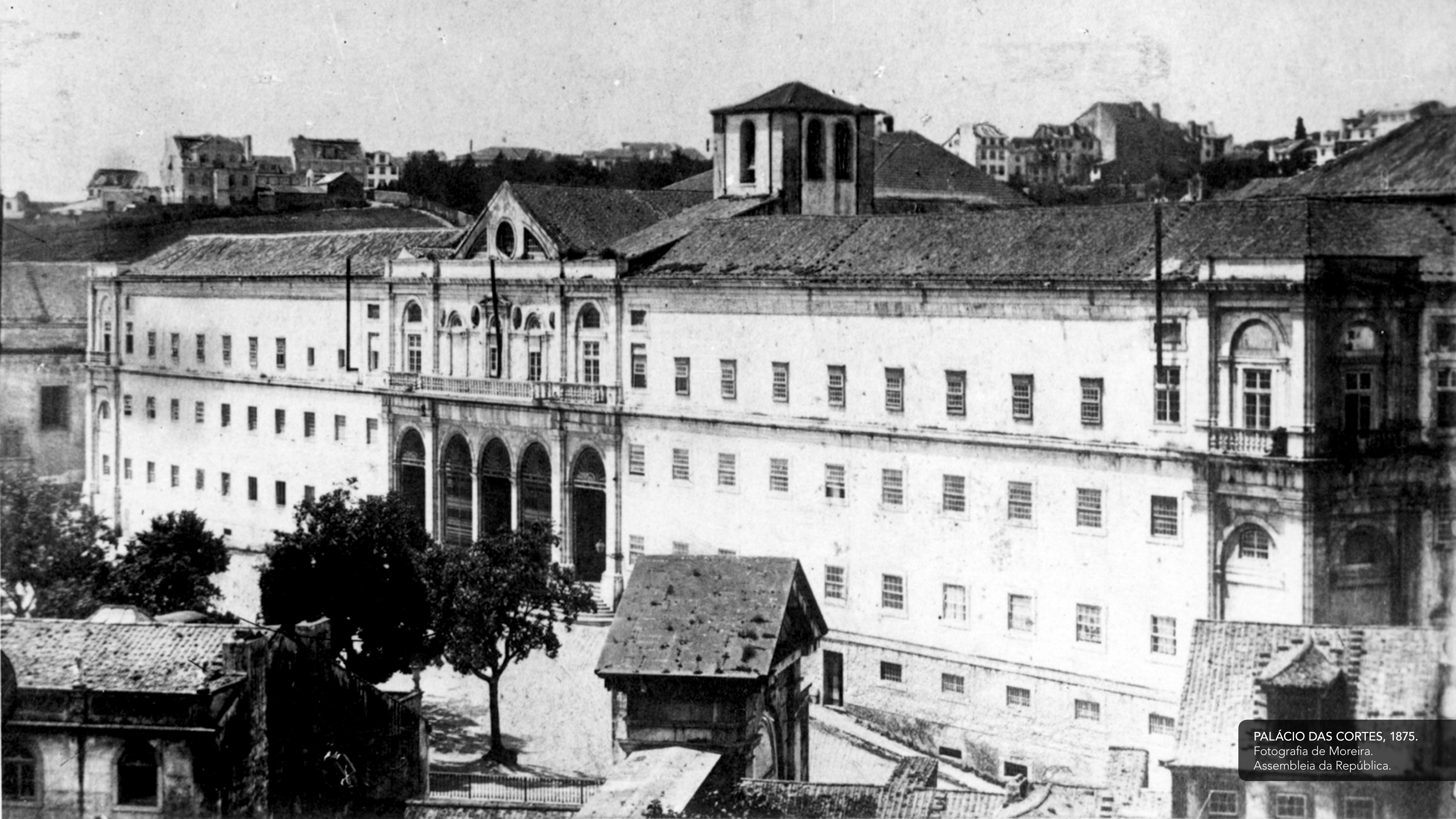
PALÁCIO DAS CORTES, 1875.