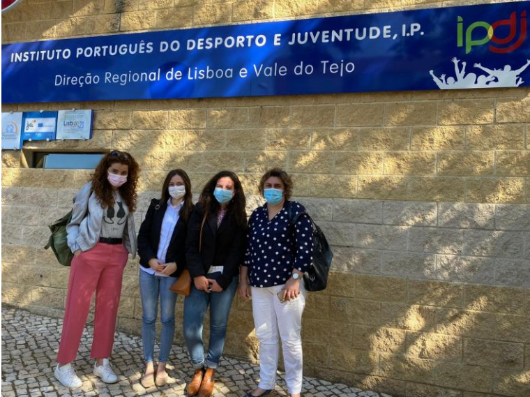
Chegada do comité ao IPDJ