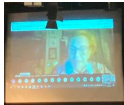
Professora Ilda Figueiredo

A professora e antiga Deputada à Assembleia da República e ao Parlamento Europeu, Ilda Figueiredo, no seu discurso destacou algumas medidas importantíssimas para extinguir a violência doméstica e no namoro. Primeiro, é necessário que exista prevenção através da educação para a igualdade e implementação da cultura da não-violência. Referiu, também, a urgência em criar medidas mais profundas para garantir a igualdade e o respeito através da proteção jurídica, social e económica das mulheres, não as colocando num espaço de vulnerabilidade, como por exemplo, o desemprego ou a exclusão social.