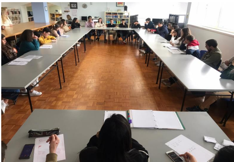
Alunos no Debate Escolar