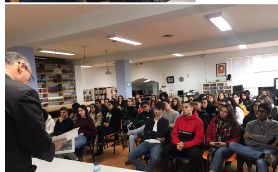
Alunos do CEF na biblioteca da escola aquando da visita do Deputado

O projeto de recomendação foi aprovado na Sessão Escolar, tendo as melhores medidas para combater esta temática.