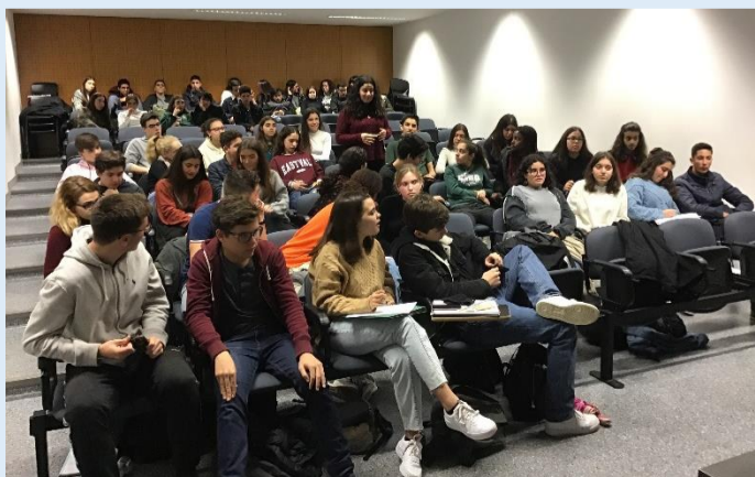
Sessão escolar no auditório da escola.