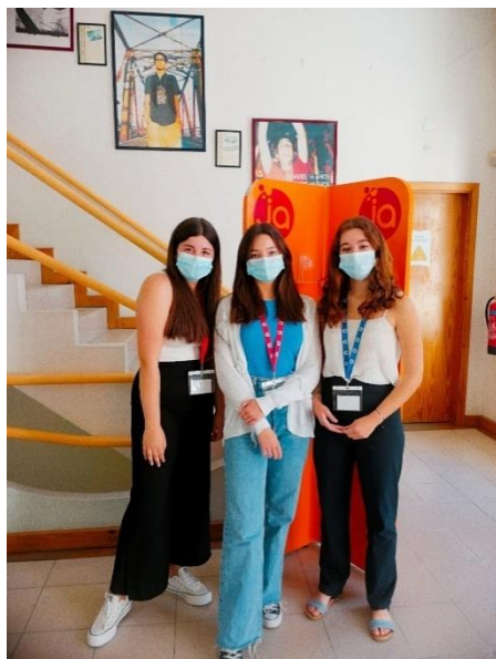
Chegada das alunas ao local de realização da videoconferência

Chegados ao local, um pouco antes da hora prevista, os alunos começaram a trocar as primeiras impressões com os restantes estudantes pertencentes a outras escolas. À medida que a hora do início de Sessão se foi aproximando, os “deputados” foram tomando os seus lugares e revendo algumas informações importantes.