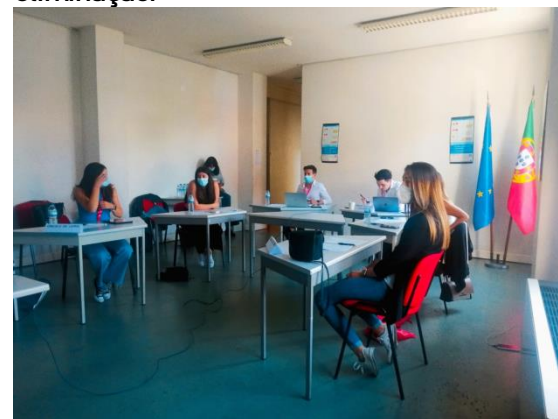
Deputados durante o debate

Das 98 medidas aprovadas nas sessões distritais de cada círculo, apenas 30 medidas foram levadas a debate. E, por isso, foram dados trinta minutos aos deputados para que pudessem discutir os seus pontos de vista dentro do seu círculo. No final deste período, os alunos tiveram que votar, a partir de um questionário online, quais as medidas que queriam eliminar, ou seja, as propostas de eliminação.