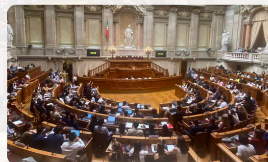
Continuação do debate e votação do Projeto de Recomendação Final

No Plenário decorreu o debate e votação do Projeto de Recomendação final a apresentar à Assembleia da República.