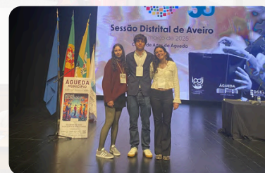
Deputados do AEJE

Ultrapassado o debate e a votação na generalidade, os trabalhos prosseguiram no sentido de alterar e/ou inserir medidas que melhorassem o projeto base, de modo a enriquecer o seu conteúdo e a eliminar possíveis lacunas que as medidas iniciais apresentassem, formulando assim o Projeto de Recomendação do círculo eleitoral de Aveiro.