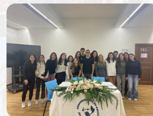
Deputados Eleitos à Sessão Escolar

Seguiu-se a Sessão Escolar que teve a participação de trinta e um deputados. Esta desenrolou-se num interessante e entusiástico debate, onde os proponentes de cada lista tiveram a oportunidade de defender as suas medidas e analisar criticamente as dos seus oponentes. Por fim, foi redigido o Projeto de Recomendação do nosso agrupamento, o Agrupamento de Escolas José Estêvão (AEJE), e foram eleitos os deputados à Sessão Distrital do círculo de Aveiro.