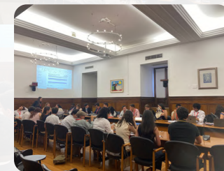
Debate na Especialidade da Comissão Nº 2, constituída pelos círculos do Porto, Europa, Évora, Santarém, Viseu, Leiria e Lisboa

O segundo dia iniciou-se com a abertura solene do Plenário pelo Senhor Presidente da Assembleia da República, José Pedro Aguiar-Branco, que destacou a importância do envolvimento dos jovens na vida política.