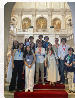
Deputados do círculo de Aveiro na AR e professoras responsáveis