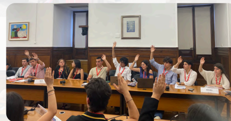
Votação na Especialidade da Comissão Nº1, constituída pelos círculos de Aveiro, Beja, Fora da Europa, Castelo Branco, Lisboa, Setúbal e Braga