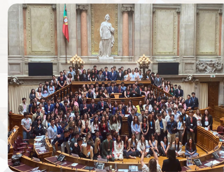
A fundadora do Parlamento dos Jovens, deputados e jornalistas presentes na Sessão Nacional

Desta forma, a fundadora do PJ realçou que este projeto é uma forma de manter Abril nos nossos corações, dando a voz aos jovens para que estes, tal como ela, continuem a luta dos nossos avós.