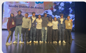
Deputados eleitos para a Sessão Nacional pelo círculo de Aveiro