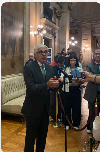
Entrevista ao Presidente da Assembleia da República

“A maior das virtudes da democracia é sabermos respeitar a diferença, aceitarmos a dimensão plural da nossa sociedade e sabermos discutir aqui, aquilo que são os nossos posicionamentos diferentes em relação ao que a sociedade expressa ao votar, mas também aqui, podermos chegar a consensos”