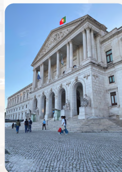
Chegada à Assembleia da República

À chegada à Assembleia da República fomos apresentados com uma receção acolhedora, que possibilitou o reencontro com colegas de sessões anteriores e o contacto com deputados e jornalistas de várias escolas, promovendo um ambiente de partilha e de troca de experiências.