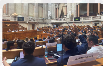
Abertura do Plenário e posterior debate

Entre as medidas discutidas, destacaram-se o incentivo à agricultura, a valorização do interior, a aplicação de tecnologias no ensino e a reestruturação da disciplina de TIC.