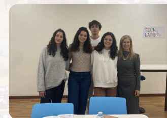
Deputados Eleitos à Sessão Distrital e Professora Responsável