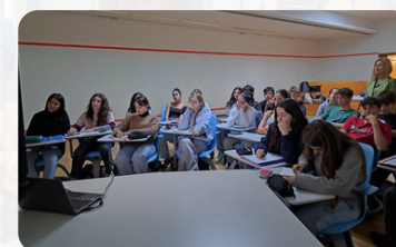
Webinar - Apoio ao desenvolvimento da 1ª fase do programa