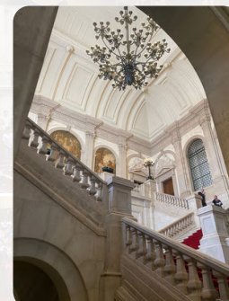
Escadaria Principal da Assembleia da República

O programa prosseguiu com a distribuição dos participantes pelas respetivas atividades. Os deputados foram encaminhados para as salas das quatro comissões, onde se iniciaram os debates — na generalidade e na especialidade — dos Projetos de Recomendação aprovados nos diferentes círculos eleitorais.