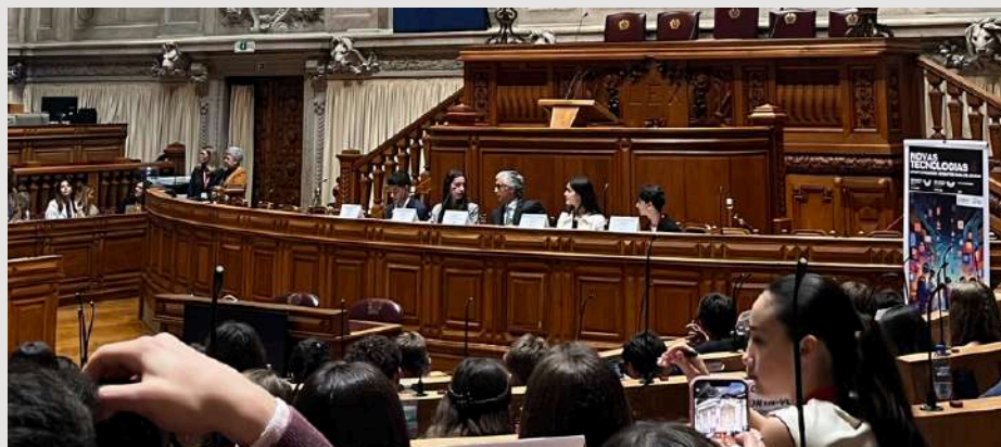
Fig.13- Abertura solene do Plenário;

Após um belo pequeno-almoço, por volta das 9h30 da manhã, já nos encontrávamos de regresso aos trabalhos, prontos para receber o GRANDE dia, o dia da Sessão Plenária.