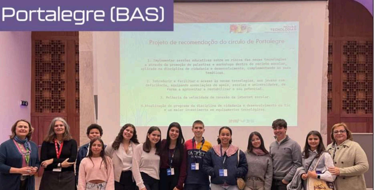
Fig.1- Sessão Regional ;