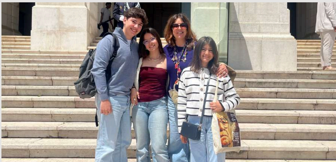
Fig.3- Chegada á AR ;

No primeiro dia de trabalho, os nervos eram inevitáveis e a ansiedade aumentava progressivamente. No entanto, em comparação com a motivação para desempenhar as tarefas propostas e, sobretudo, com o desejo de aproveitar a experiência de forma positiva e enriquecedora, esses sentimentos tornaram-se irrelevantes.