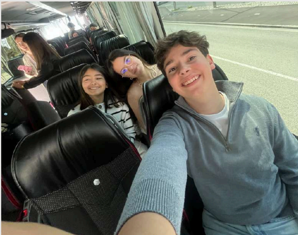
Fig.2- A caminho da AR ;