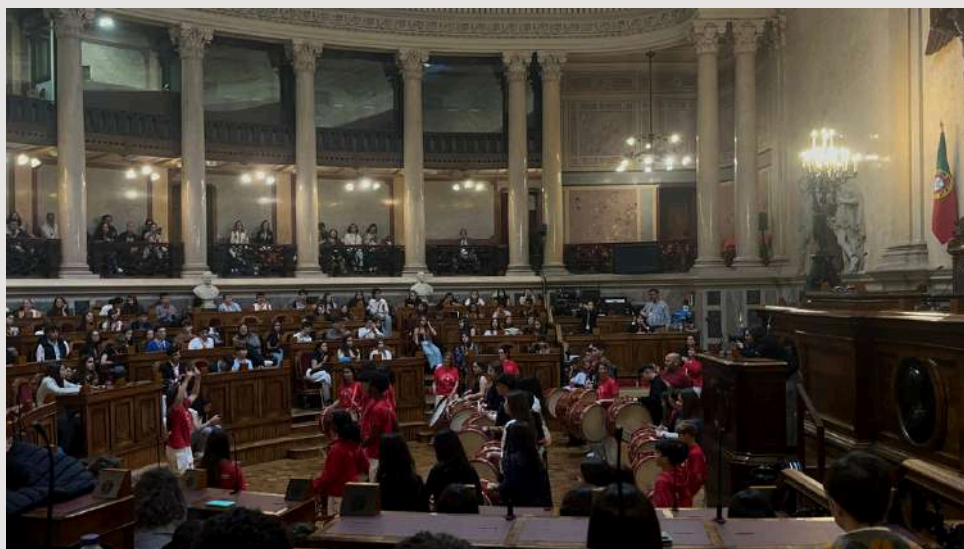
Fig.7- Programa cultural ;

Quando os trabalhos das comissões decidiram dar uma pausa fomos todos lanchar em conjunto.