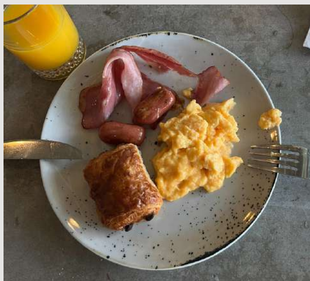
Fig.12- Pequeno almoço;