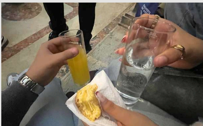
Fig.4- Lanche de boas vindas ;

Posteriormente, realizámos uma visita guiada pela AR , para nos familiarizarmos com o espaço onde decorreriam as atividades. Após esta breve orientação, iniciámos os trabalhos com entusiasmo e concentração.