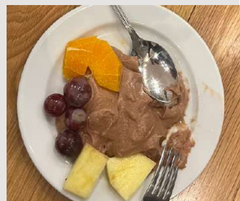
Fig.8,9 e 10- Jantar ;