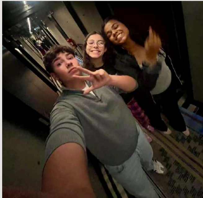
Fig.11- No hotel ;

Às 20h30, chegou o transfer que nos conduziu ao hotel, ( Hotel JAM).