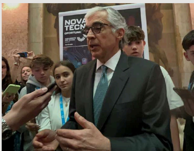
Fig.14- Momento entre José Pedro Aguiar-Branco e jornalistas presentes;

Das 10:45 às 12:00, decorreu o período de perguntas entre os deputados presentes. Mas pelas 10:40, os jornalistas estiveram presentes numa espécie de entrevista com José Pedro Aguiar-Branco, aproveitando para lhe propôr certas questões.