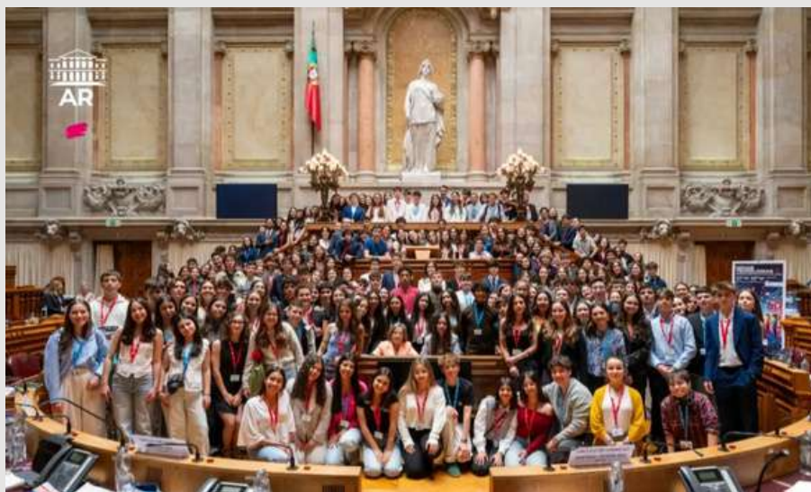
Fig.15- Fotografia de grupo;

Até às 12:55, decorreu-se o debate da recomendação final à AR.