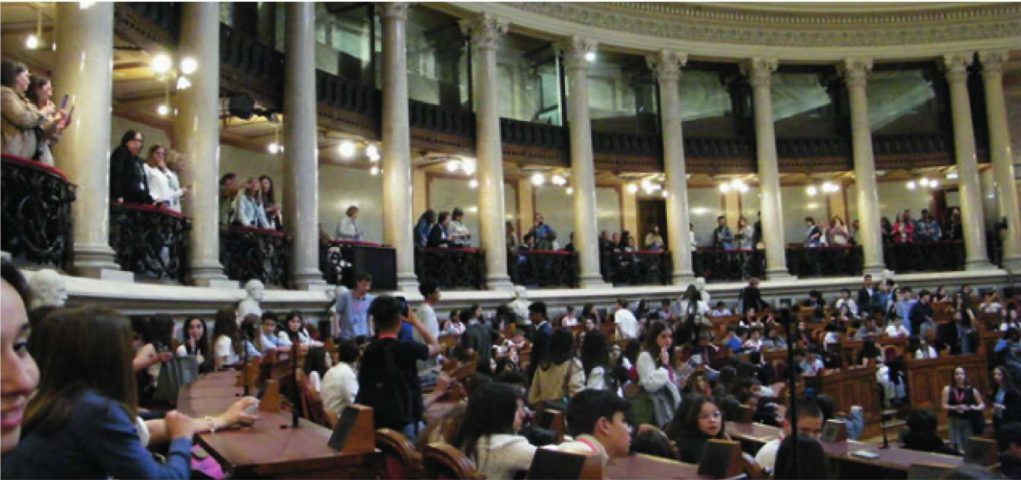
AR - Sessão Plenária - dia 13 de maio