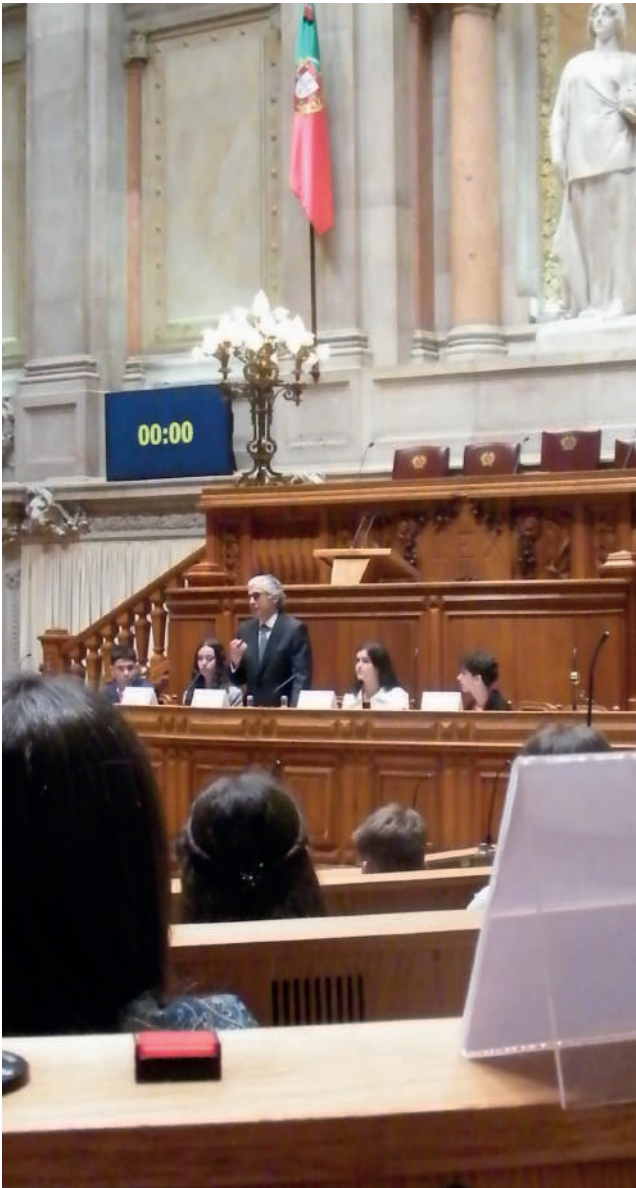
Dr. Aguiar Branco