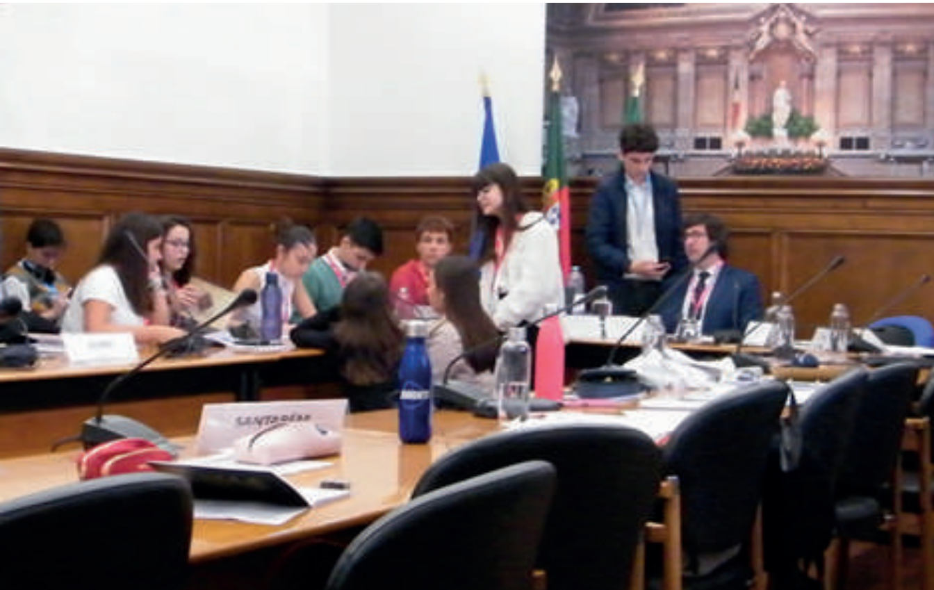
Discussão e Votação das Proposta das Comissões 1.º dia

Na manhã do dia 13 de maio, pelas 10h00, a Sessão Plenária do Parlamento dos Jovens, foi aberta solenemente pelo Presidente da Assembleia da República, Dr. José Pedro Aguiar-Branco.