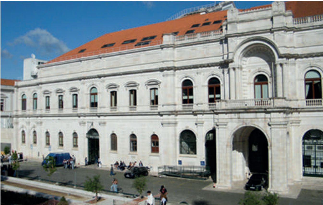
Assembleia da República